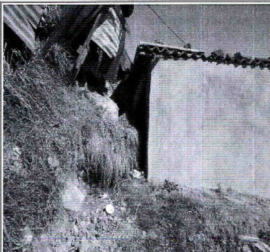
Foto No. 3. Material desprendido del talud del predio de la Calle 71 A Sur No. 20 A - 61 impacta muro perimetral vivienda de la Calle 71 A Sur No. 20 A - 55