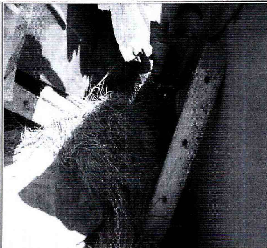
Foto No. 4. Material desprendido del talud del predio de la Calle 71 A Sur No. 20 A - 61 impacta muro perimetral vivienda de la Calle 71 A Sur No. 20 A - 55