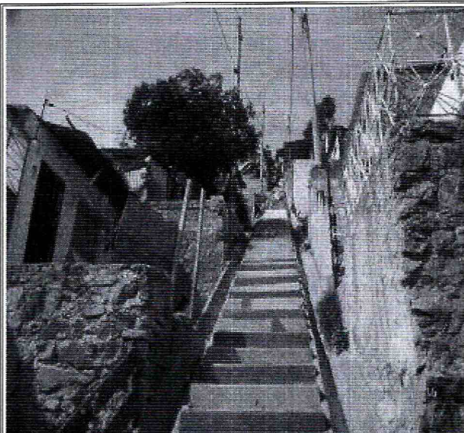
Foto No. 1. Via de acceso al predio de la Calle 71 A Sur No. 20 A - 55