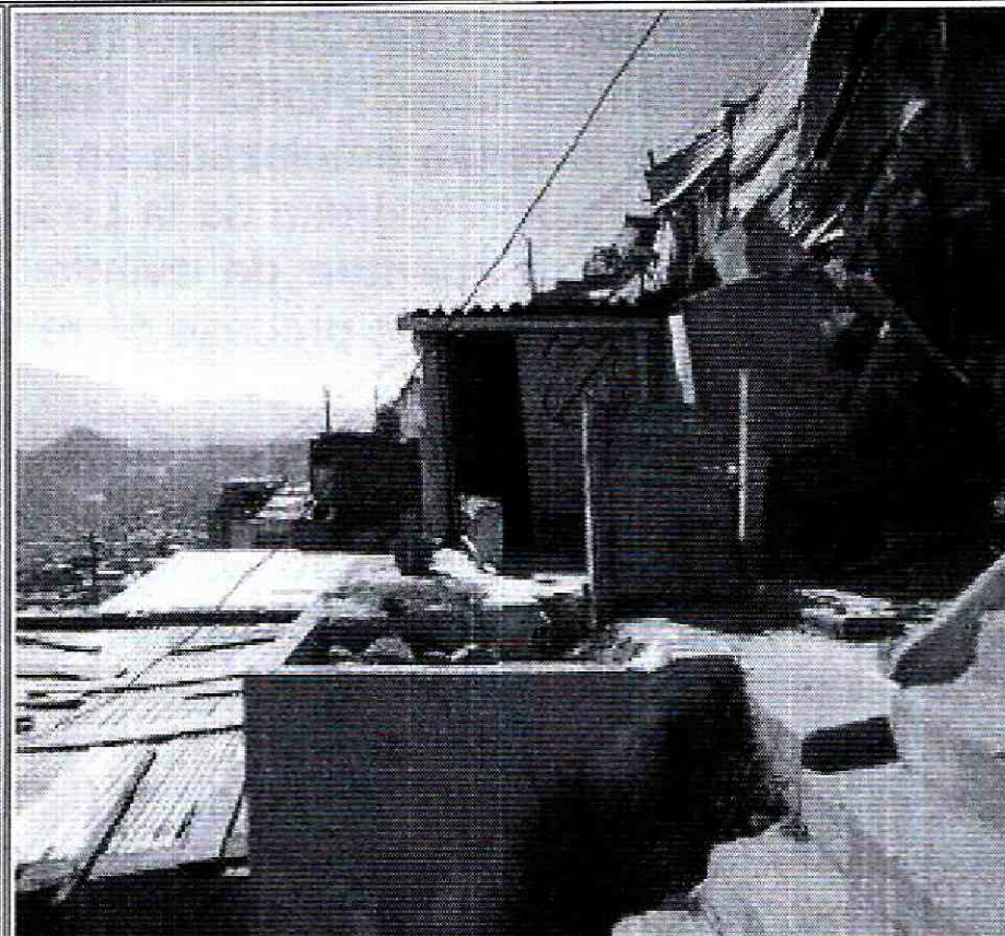
Foto No. 2. Vista vivienda en el predio de la Calle 71 A Sur No. 20 A - 55