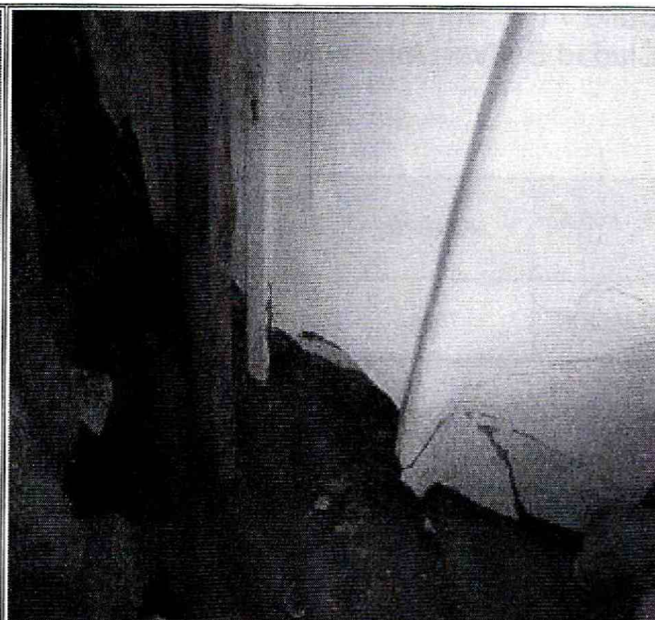
Foto No. 6. Vista interior muro perimetral costado occidental vivienda emplazada en el predio de la Calle 71 A Sur No. 20 A - 55