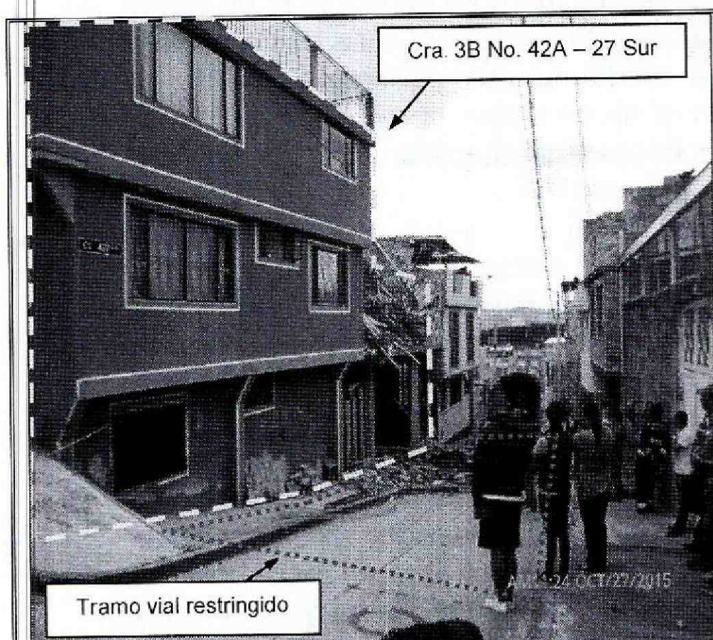
Fotografía 1. Vista del predio de la Carrera 3 B Este No. 42 A - 27 Sur, en el barrio La Gloria de la Localidad de San Cristóbal. Se observa el sector donde se desarrolla la construcción de una edificación.