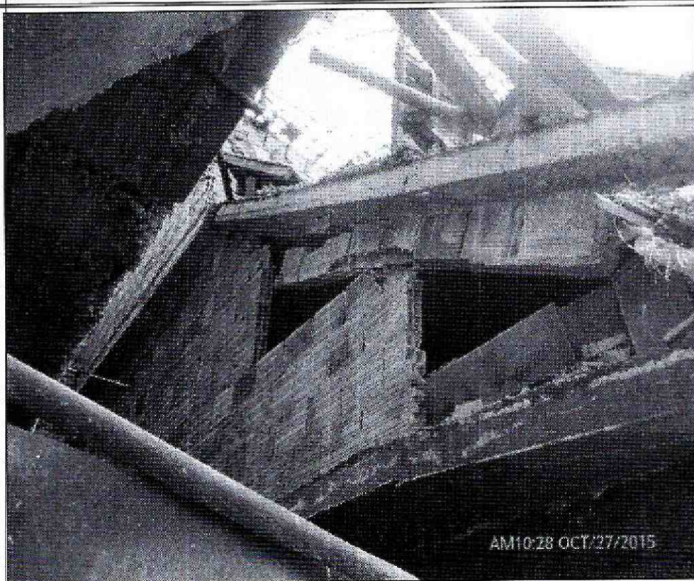
Fotografía 3. Vista de la placa del segundo nivel que colapsa en un 50% aproximadamente, junto con los muros de cerramiento afectados. Se observan elementos de construcción con posibilidad de caída hacia la zona de acceso al apartamento del primer nivel de la edificación del costado oriental.