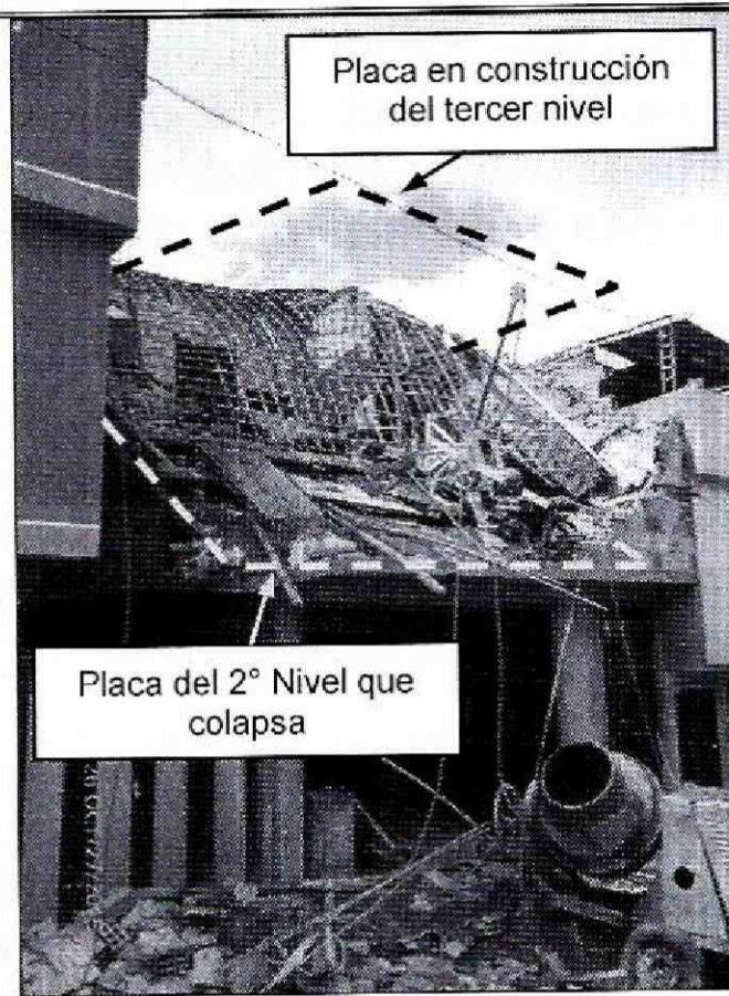
Fotografía 2. Vista de la construcción ubicada al costado occidental del predio de la Carrera 3 B Este No. 42 A - 27 Sur, en el barrio La Gloria de la Localidad de San Cristóbal. Se observa el colapso de la placa en construcción y placa del segundo nivel.