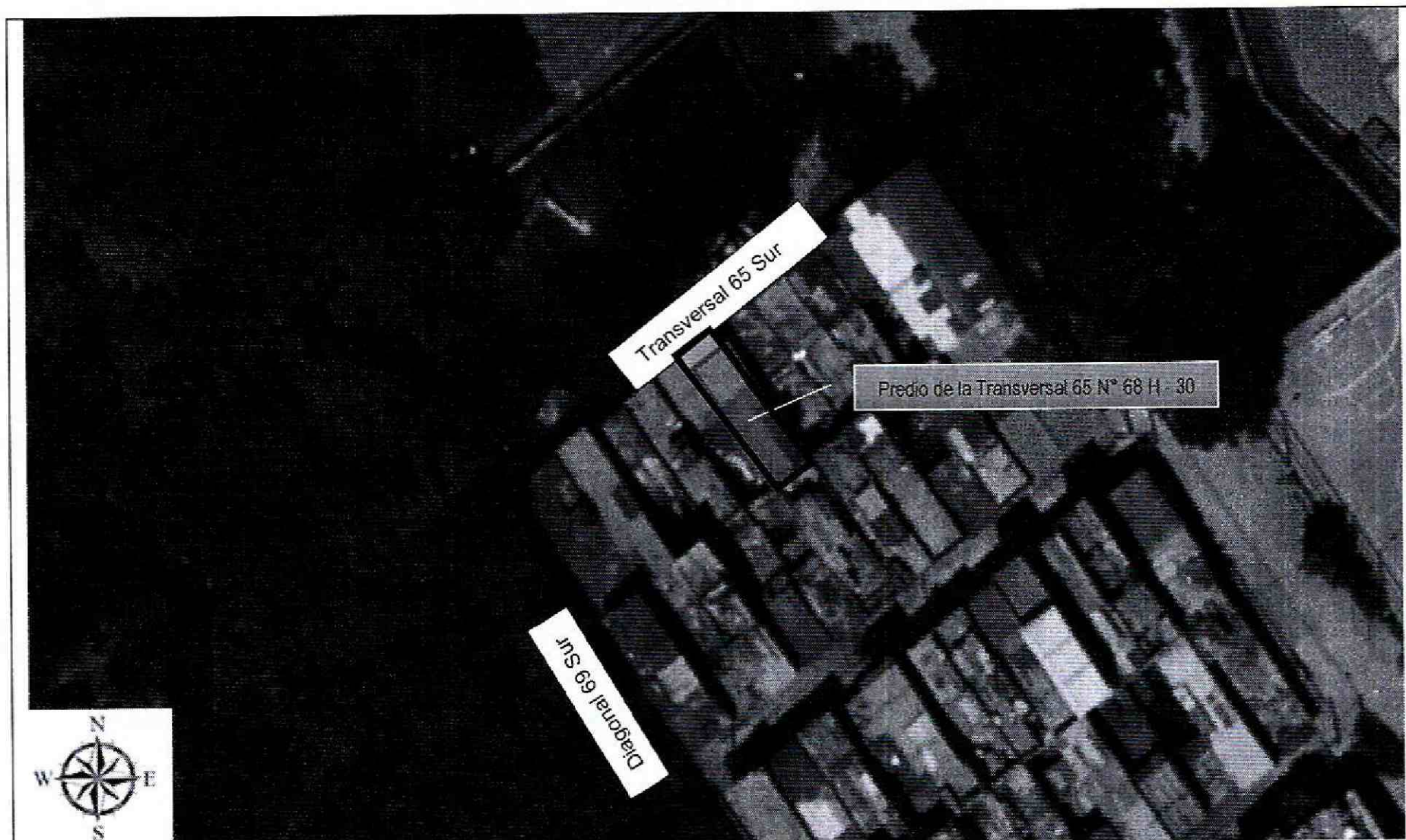
Figura 1. Localización del predio de la Transversal 65 N° 68 H – 30 Sur, del Desarrollo Sierra Morena de la Localidad de Ciudad Bolívar, presenta Amenaza media por remoción en masa, no presenta riesgo por inundación (Decreto 190 de 2004 POT).