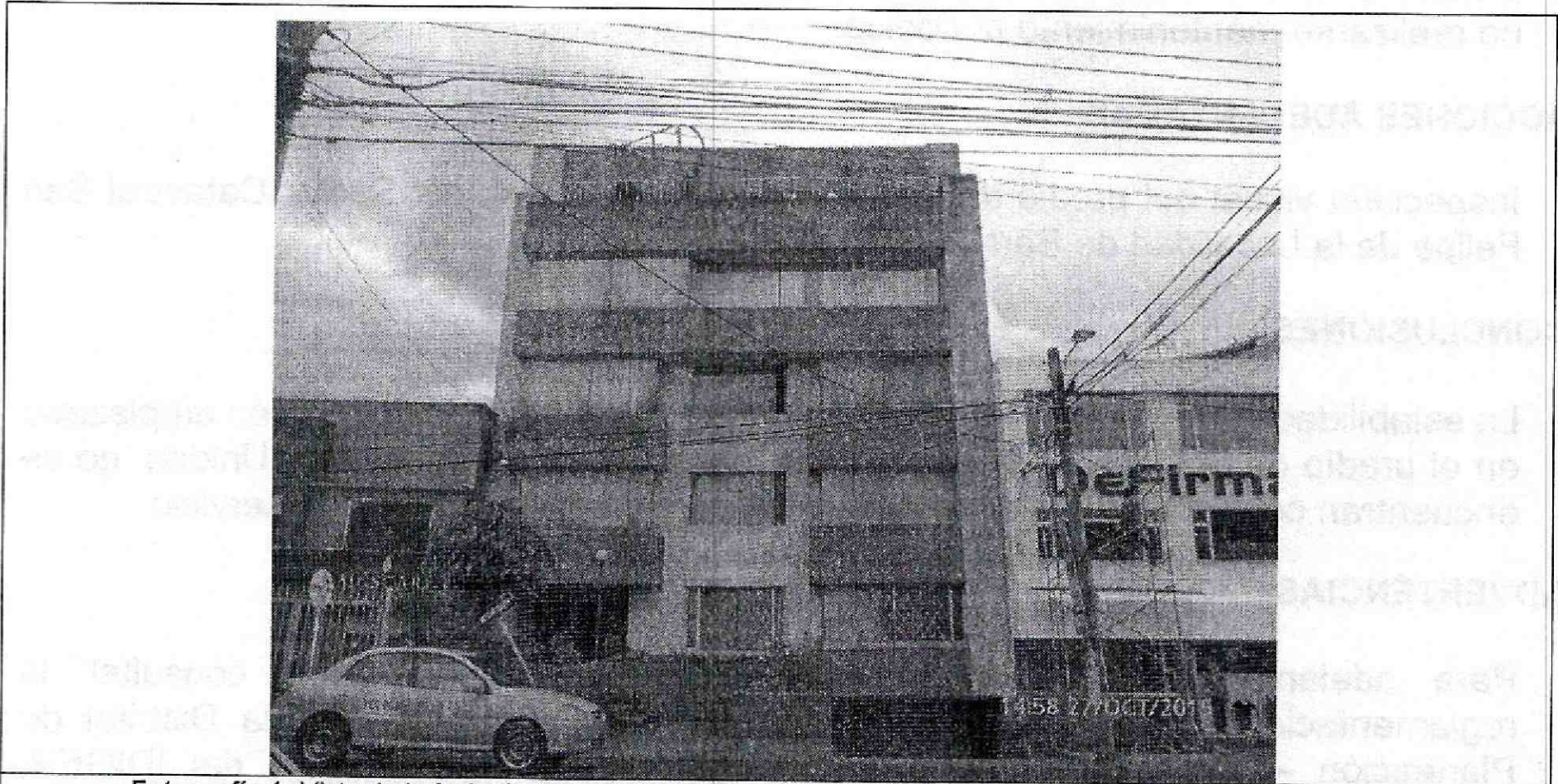
Fotografía 1: Vista de la fachada del predio de la Carrera 20 B N° 75-54, de la Localidad de Barrios Unidos