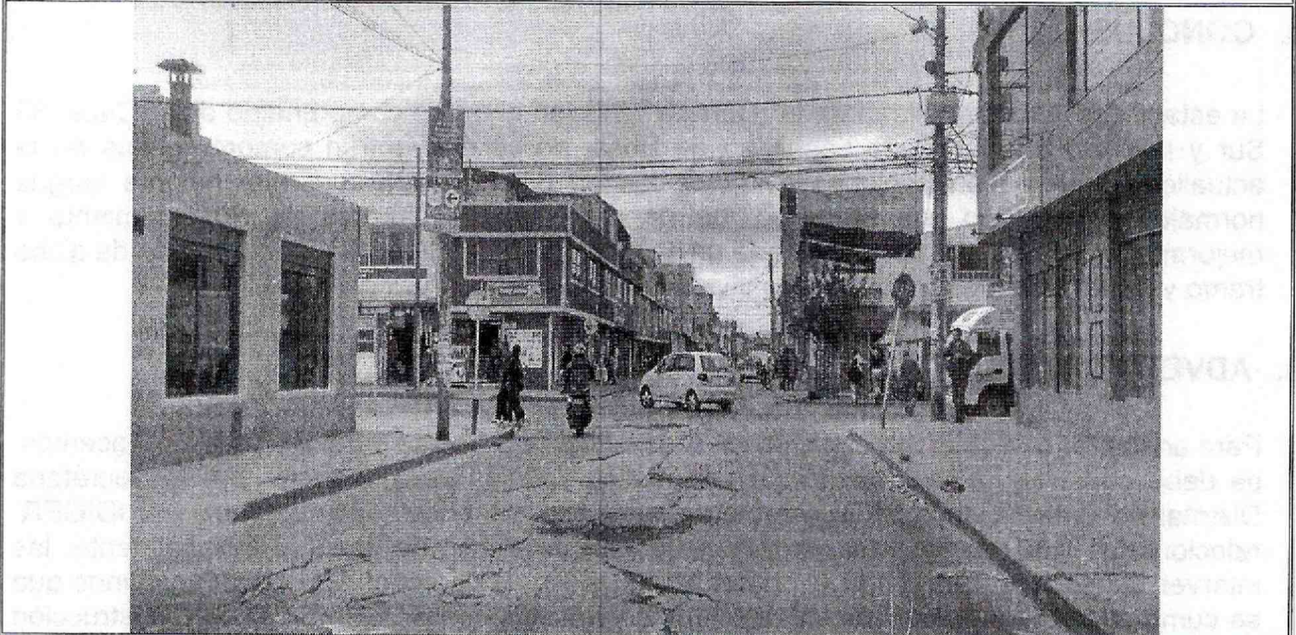
Foto No. 1. Se evidencian las afectaciones sobre la vía de la Carrera 78 B llegando a la Calle 63 Sur, de la Localidad de Bosa.