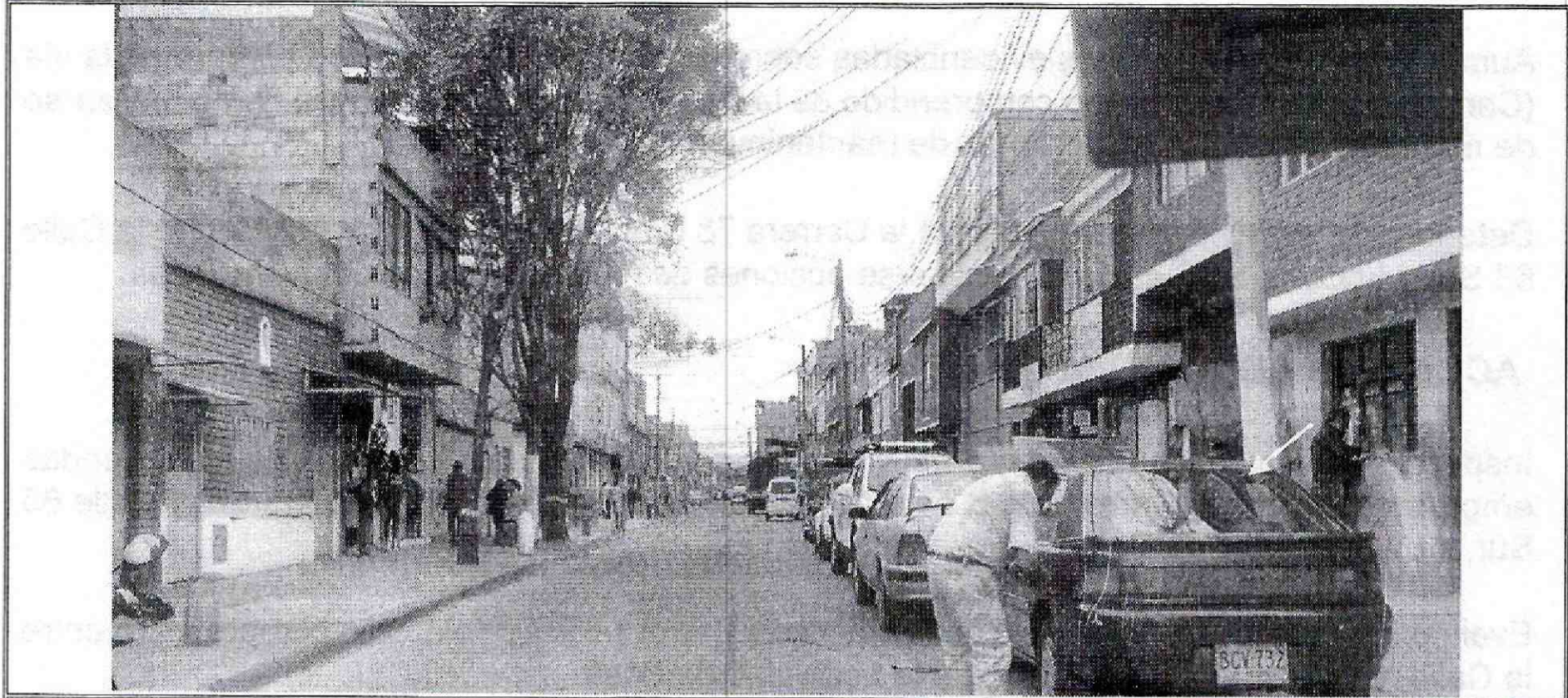
Foto No. 1. Se evidencian la Carrera 78 B y las viviendas paralelas a la vía.