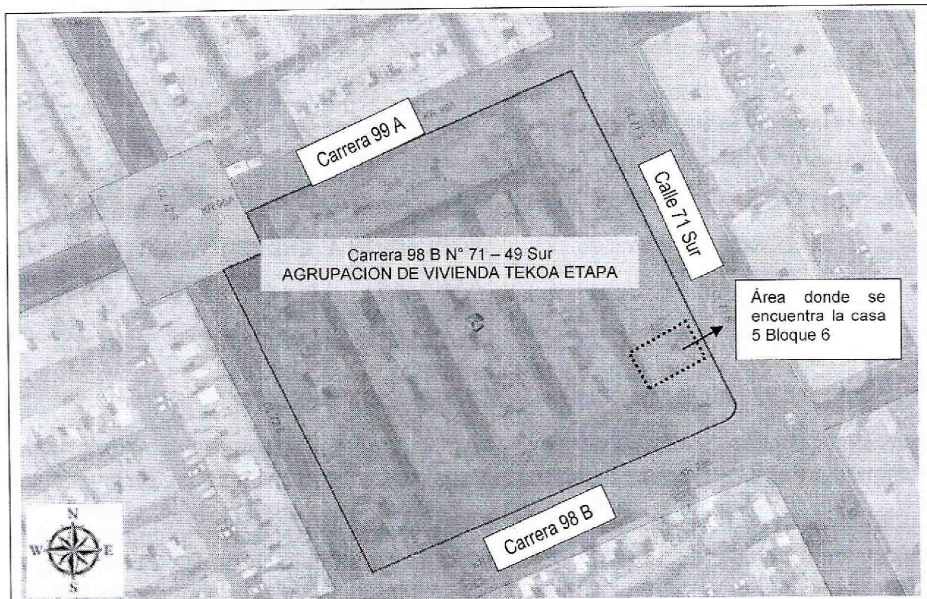
Figura 1. Localización del predio de la Carrera 98 B N° 71 – 49 Sur, del Sector Catastral Ciudadela El Recreo de la Localidad de Bosa, no presenta amenaza por remoción en masa, y presenta amenaza media por inundación (Decreto 190 de 2004 POT).

La zona donde se encuentra el predio de la Carrera 98 B N° 71 – 49 Sur, pertenece al Sector Catastral Ciudadela el Recreo en la Localidad de Bosa y de acuerdo con el plano normativo del Plan de Ordenamiento Territorial de Bogotá – POT (Decreto 190 de 2004, por el cual se compilan los Decretos 619 de 2000 y 469 de 2003), no presenta condición de Amenaza por procesos de remoción en masa y presenta amenaza media por inundación.