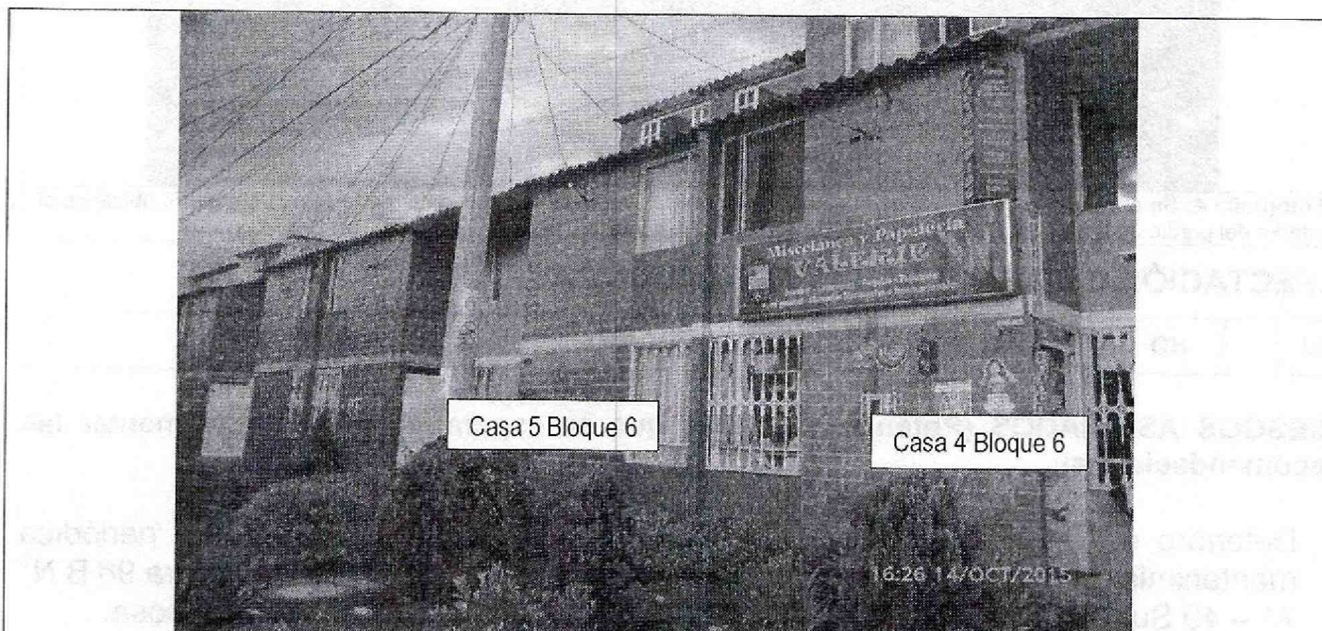
Fotografía 1: Vista de la fachada de las casa 4 y 5 del bloque 6, ubicadas al interior del predio de la Carrera 98 B N° 71 – 49 Sur, Conjunto residencial Tekoa.