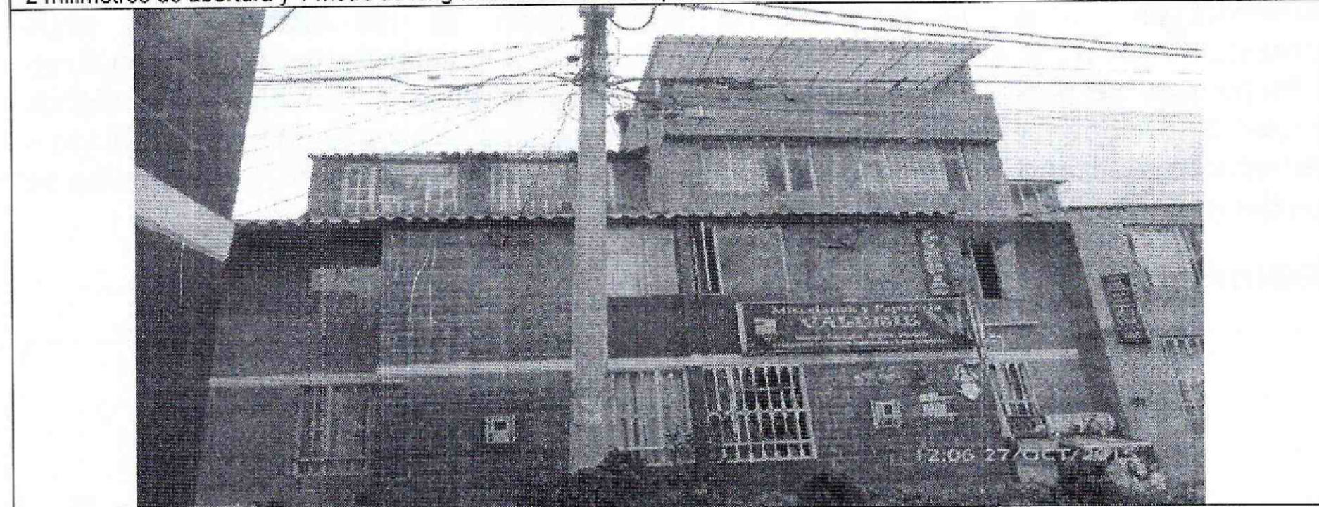
Fotografía 4: Se observa el cuarto nivel de la casa 4 del bloque 6, ubicada al costado sur de la casa 5 bloque 6, ubicados al interior del predio de la Carrera 98 B N° 71 – 49 Sur, Conjunto residencial Tekoa.