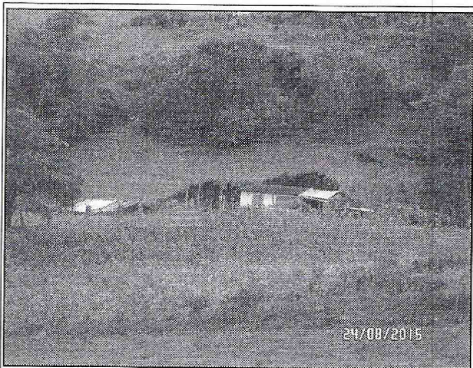
Fotografía 1. Vista del proceso de remoción en masa que está afectando la vivienda ubicada en la Finca Los Borracheros, en La Vereda Olarte de la Localidad de Usme