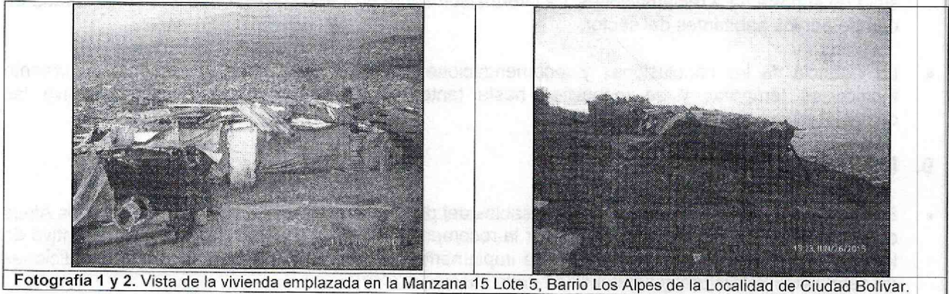
Fotografía 1 y 2. Vista de la vivienda emplazada en la Manzana 15 Lote 5, Barrio Los Alpes de la Localidad de Ciudad Bolívar.