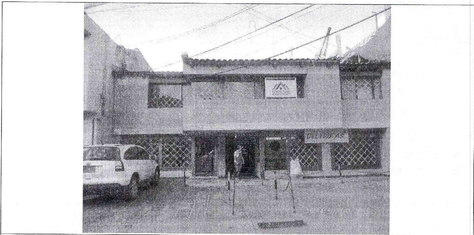
Fotografía 1: Vista de la fachada del predio de la Calle 98 N° 10-56