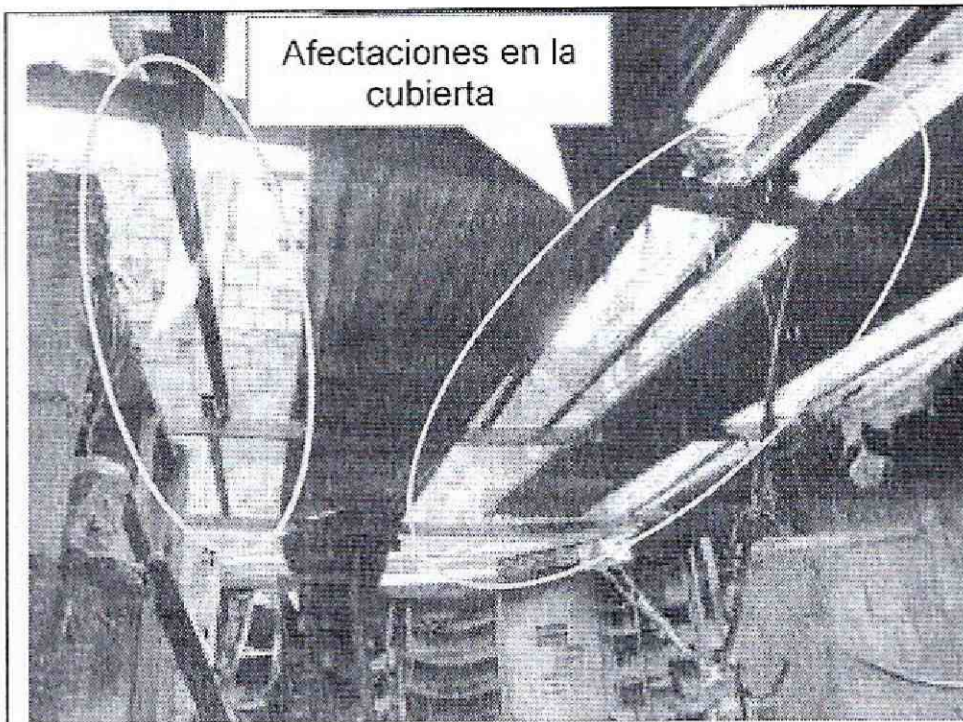
Fotografía 3. Vista de las afectaciones de la cubierta en el segundo nivel del inmueble de la Calle 93 Sur No. 4 C-31; deformación de los elementos metálicos de soporte de la cubierta e incineración total de las tejas plásticas.