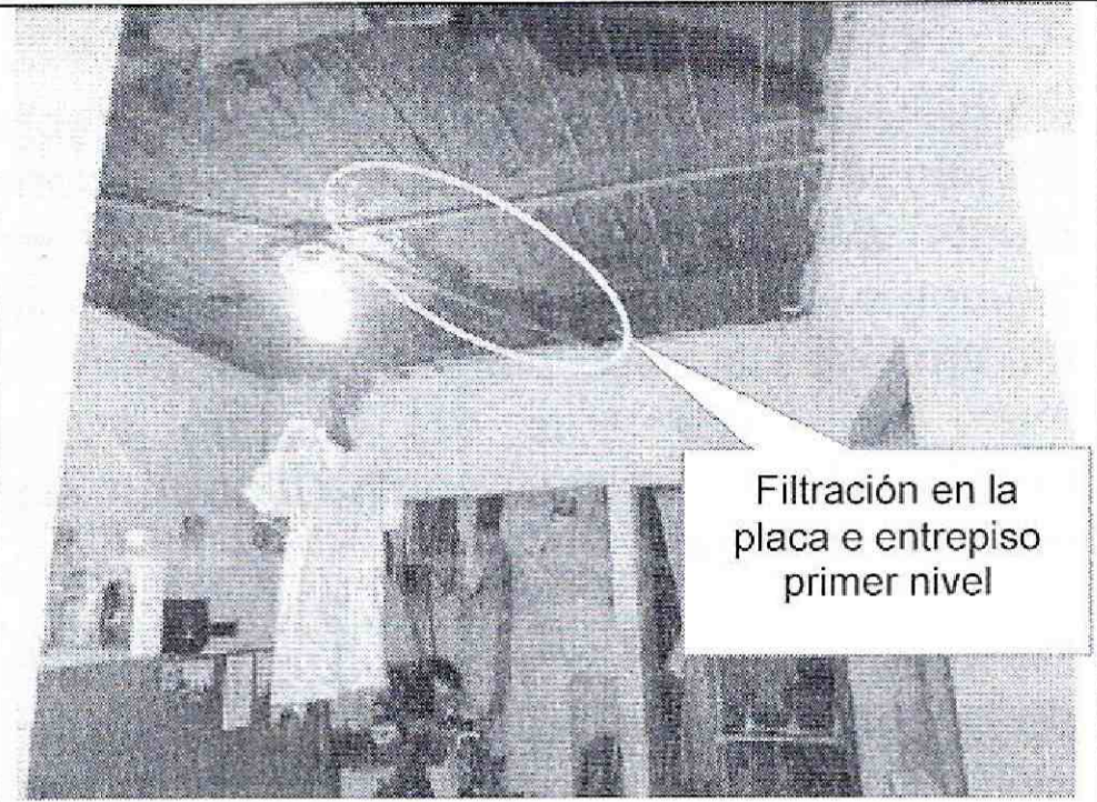
Fotografía 4. Primer nivel del inmueble de la Calle 93 Sur No. 4C-31, se aprecian algunas filtraciones en la placa de entepiso.