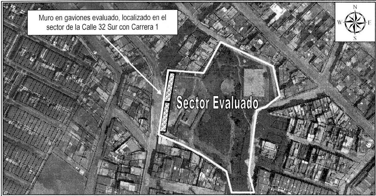
Figura 1. Localización para el sector de la Calle 32 Sur con Carrera 1, Sector Catastral Bello Horizonte de la Localidad de San Cristóbal.