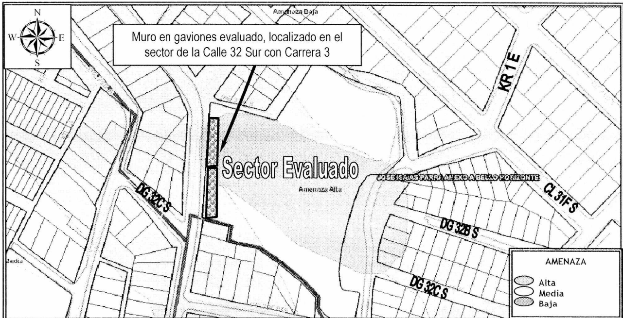
Figura 2. Localización y nivel de amenaza alta para el sector de la Calle 32 Sur con Carrera 1, Sector Catastral Bello Horizonte de la Localidad de San Cristóbal (Imagen tomada del GEOPORTAL).