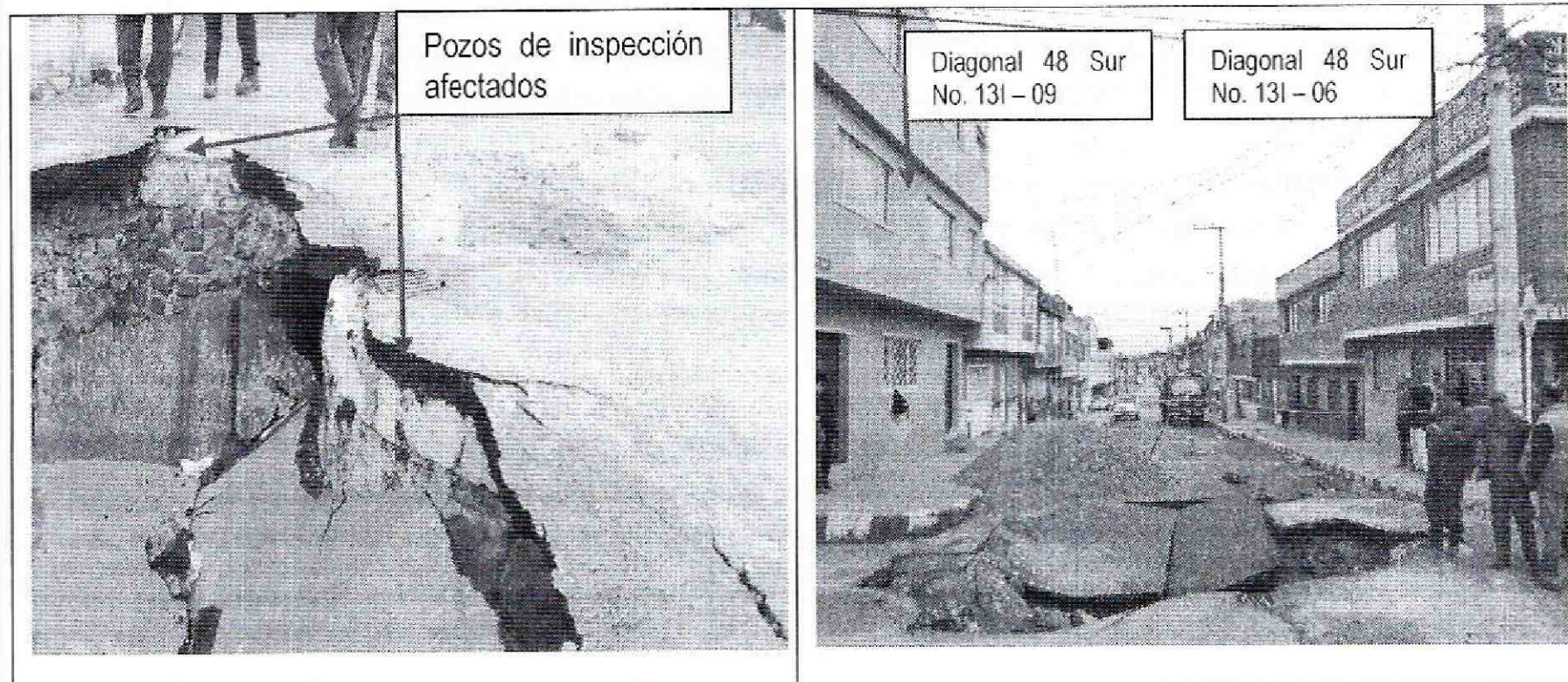
Fotografía 3 y 4. Pozos de Inspección afectados por el proceso de subsidencia y predios de la Diagonal 48 Sur No. 131 – 09 y Diagonal 48 Sur No. 131 – 06, en el Barrio Marco Fidel Suarez, de la Localidad de Rafael Uribe Uribe.