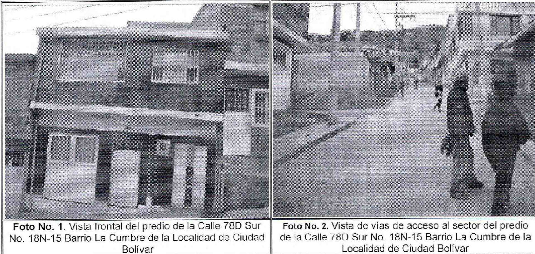
Foto No. 1. Vista frontal del predio de la Calle 78D Sur No. 18N-15 Barrio La Cumbre de la Localidad de Ciudad Bolívar