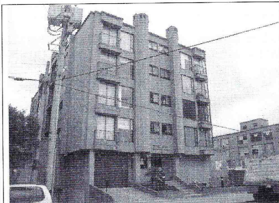
Foto 1. Vista de la fachada del edificio Ozum, emplazado en el predio de la Transversal 19 A No. 95 - 78