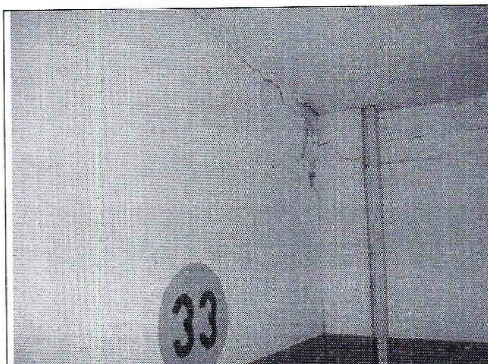
Foto 3. Agrietamientos en los muros de cerramiento del costado norte del predio en la zona del sótano.