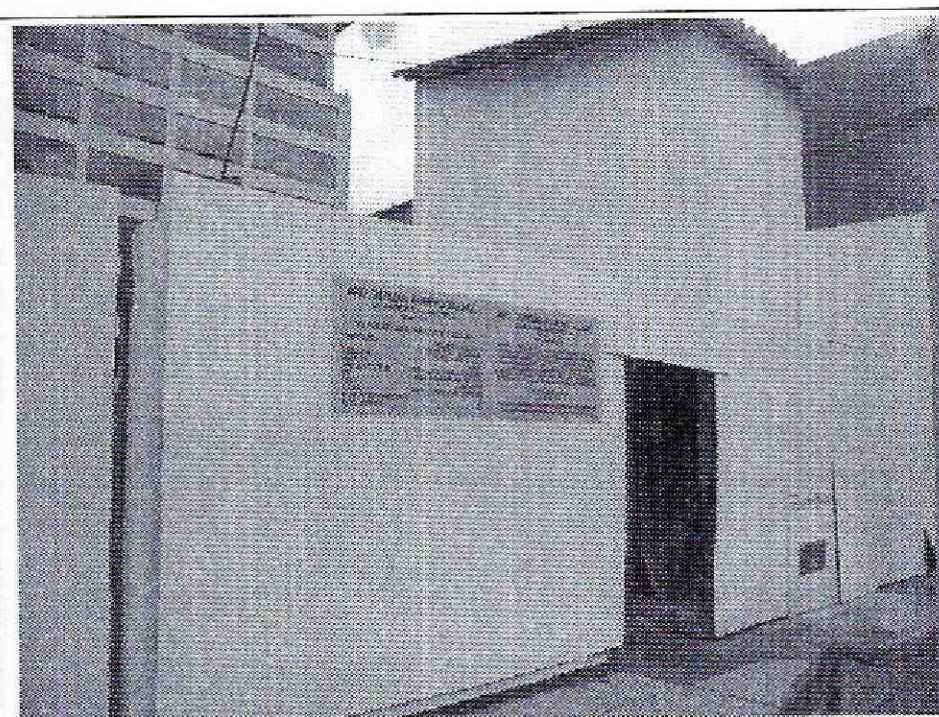
Foto 4. Detalle del predio donde se adelantan labores de obra.