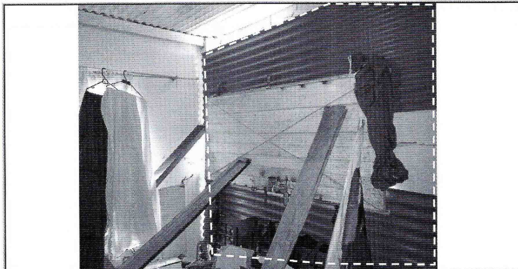
Foto No. 3. Vista de las láminas de zinc utilizadas por los responsables del predio en la zona donde se presentó el colapso del muro perimetral perteneciente a la vivienda emplazada en el predio de la Calle 78C Sur # 17J – 64 Manzana 8 Lote 11 (SDP) del a Barrio Buenos Aires II en la Localidad de Ciudad Bolívar.