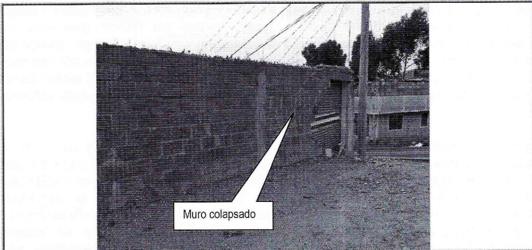
Foto No. 2. Vista desde el costado suroccidental del muro afectado por la colisión del vehículo particular con la vivienda emplazada en el predio de la Calle 78C Sur # 17J – 64 Manzana 8 Lote 11 (SDP) del a Barrio Buenos Aires II en la Localidad de Ciudad Bolívar.