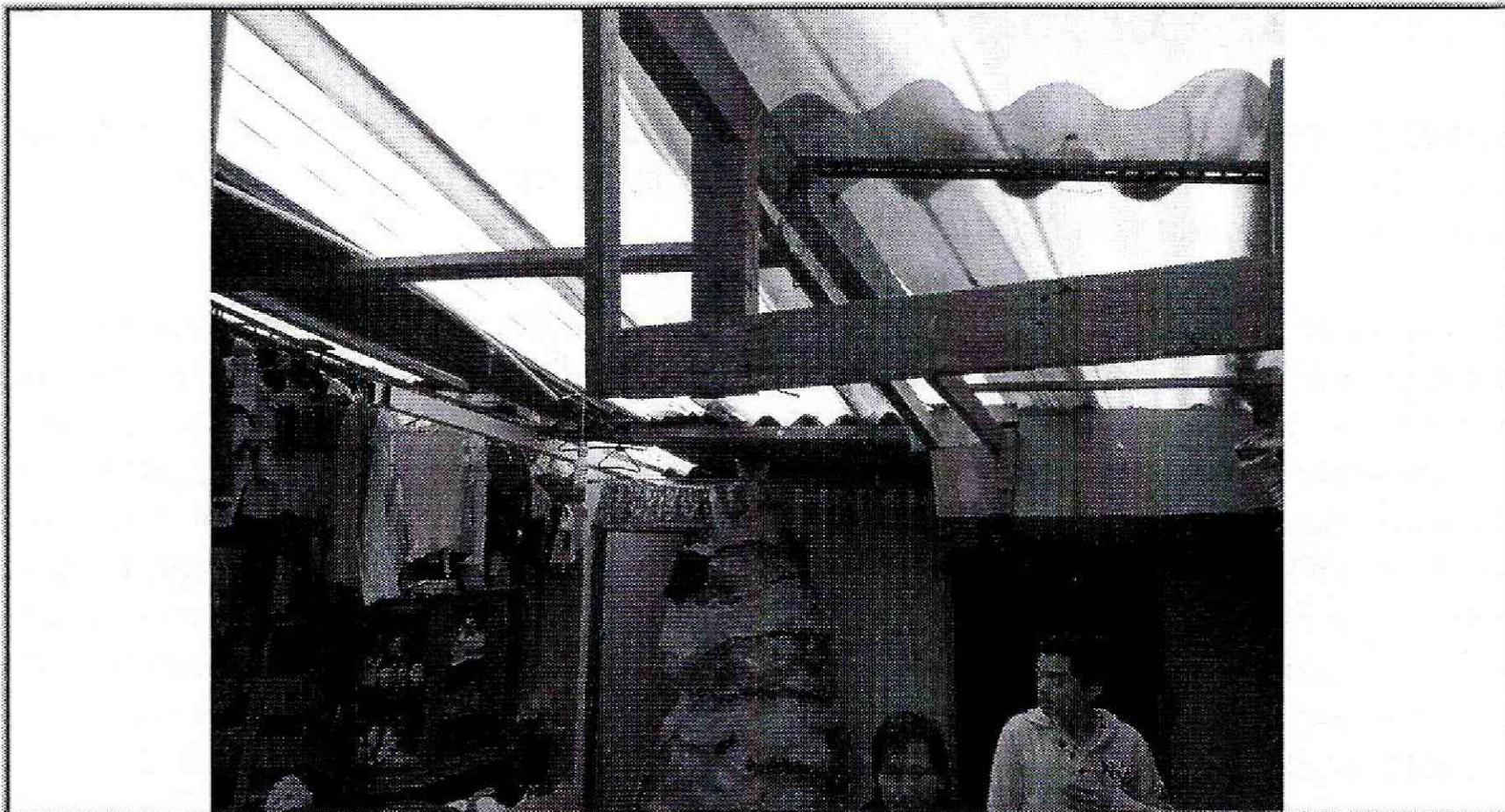
Foto No. 4. Vista de la cubierta desde el interior de la vivienda emplazada en el predio de la Calle 78C Sur # 17J – 64 Manzana 8 Lote 11 (SDP) del a Barrio Buenos Aires II en la Localidad de Ciudad Bolívar.