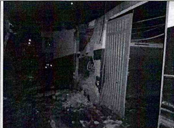
Foto 2. Se observa el estado del predio después de retirado el vehículo.