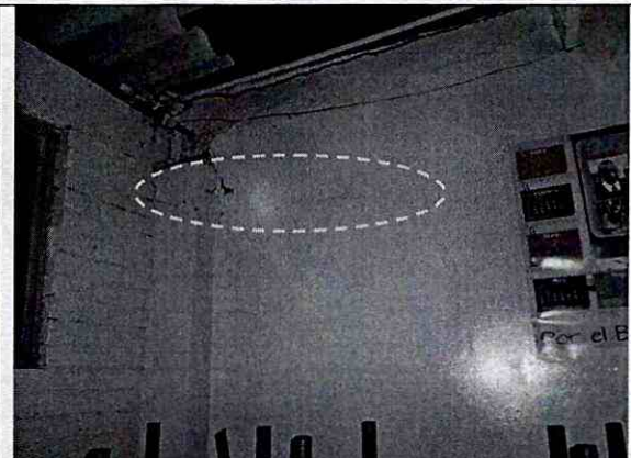
Foto 4. Detalle al interior de un aula ubicada al costado oriental donde se presentó la colisión del vehículo, se presentan fisuras que no comprometen la estabilidad estructural de este espacio.