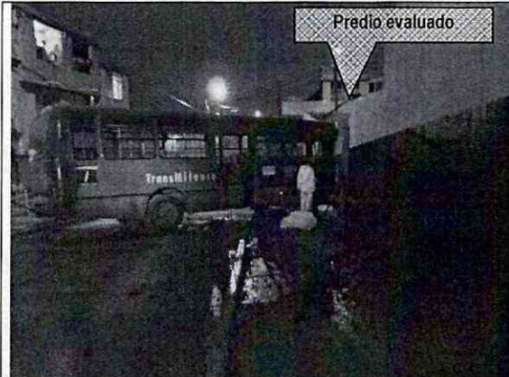
Foto 1. Se observa el vehículo de transporte público colisionado en el predio de la Calle 75 Sur # 18B - 45.