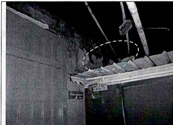
Foto 3. Se observan fragmentos del muro colapsado los cuales se depositaron en una caseta.