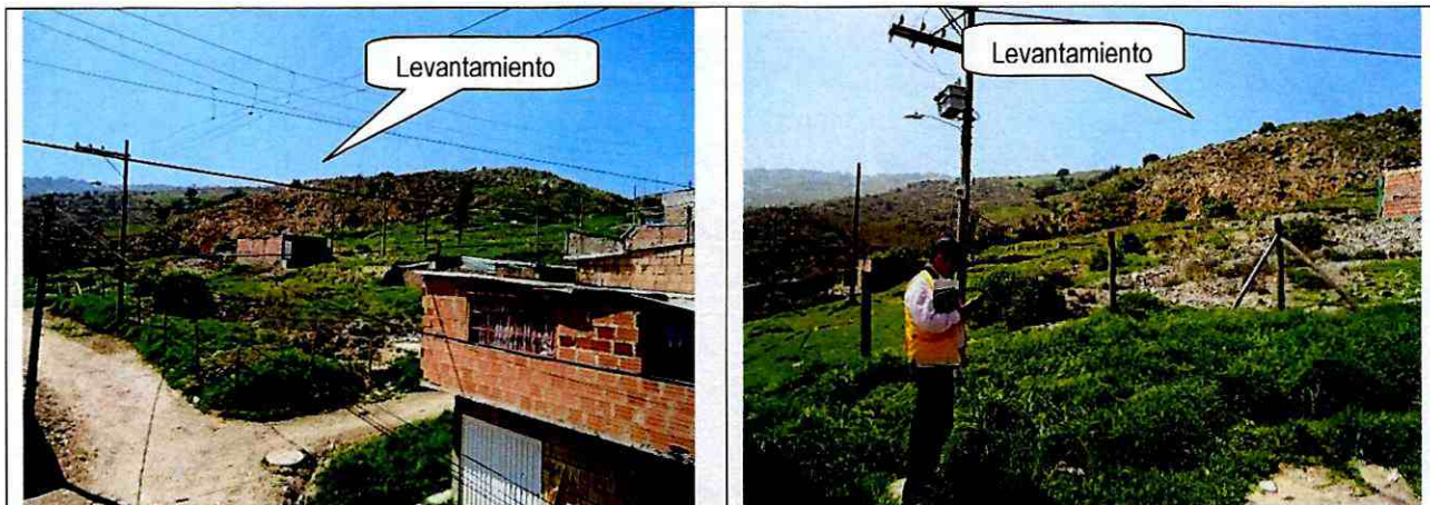
Fotos 1 y 2. Vista del levantamiento por la presión de la masa deslizada de El Espino, parte superior de la ladera, sobre el flanco izquierdo del deslizamiento de Altos de La Estancia, zona norte del desarrollo San Rafael Altos de La Estancia donde se presenta la caída de bloques