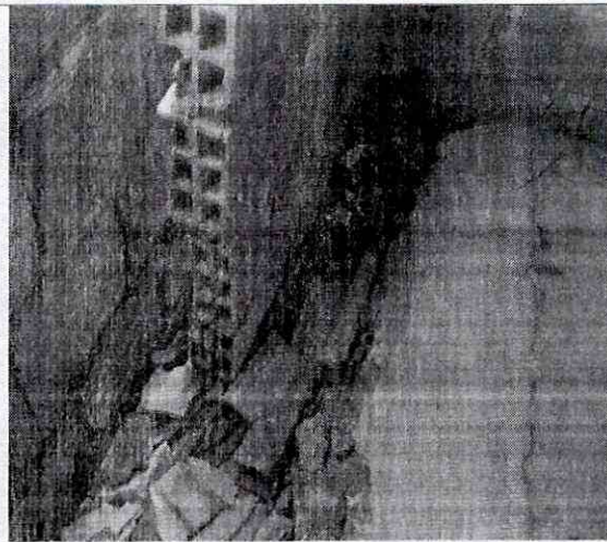
Fotografía No. 4. Perdida de material y agrietamiento en los pisos de la vivienda con nomenclatura Transversal 18 Bis A # 78C – 50 Sur