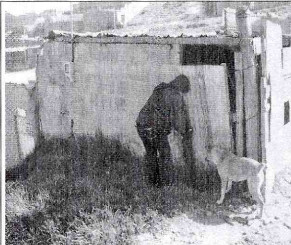
Fotografía No. 1. Fachada de la vivienda con nomenclatura Transversal 18 Bis A # 78C – 50 Sur