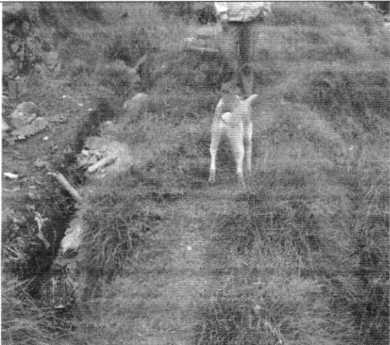
Fotografía No. 3. Vista superior del talud anexo a la vivienda con nomenclatura Carrera 75 # 76 – 32 Sur.