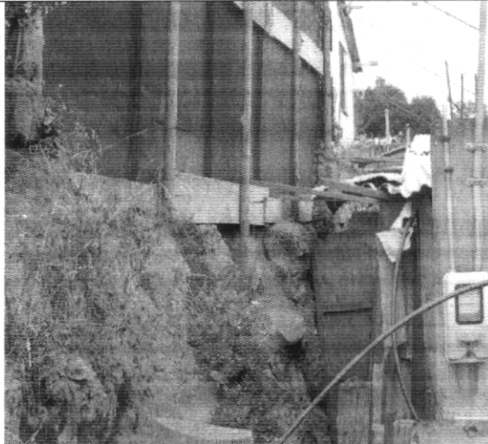
Fotografía No. 4. Talud sobre el cual se encuentra emplazada la vivienda con nomenclatura Carrera 75 # 76 – 32 Sur.