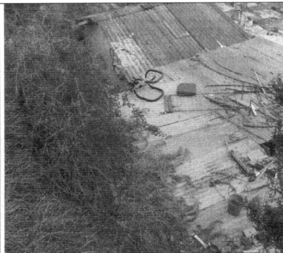
Fotografía No. 2 Vista superior del talud anexo a la vivienda con nomenclatura Carrera 75 # 76 – 32 Sur.