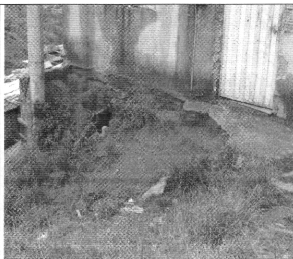
Fotografía No. 2 Se evidencia fenómeno de erosión transporte de material en el andén de la vivienda con nomenclatura Carrera 74B # 76 – 19 Sur