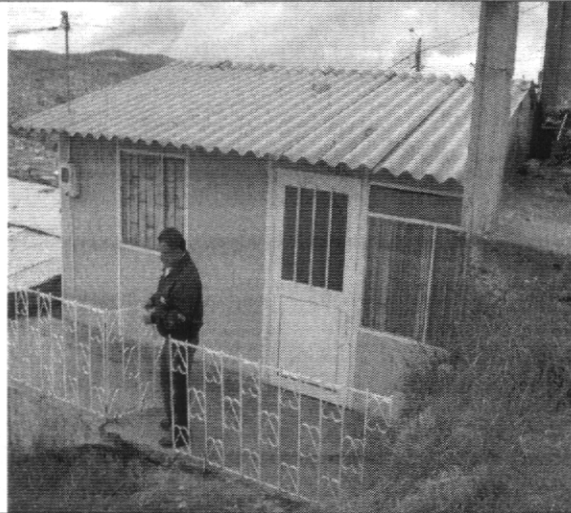
Fotografía No. 4. Fachada de la vivienda con nomenclatura Carrera 74B # 76 – 15 Sur, para la cual se emitió orden de evacuación, su deterioro amenaza con colapso sobre la vivienda con nomenclatura Carrera 74 B # 76 – 19 Sur.