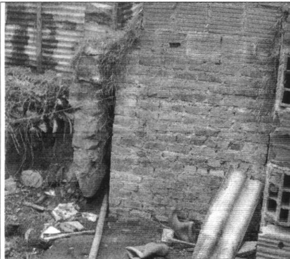
Fotografía No. 5. Detalle desplazamiento y pérdida de verticalidad del muro de contención sobre el que se emplaza la vivienda con nomenclatura Carrera 74 B # 76 – 15 Sur, el cual amenaza con colapsar sobre la vivienda con nomenclatura Carrera 74B # 76 – 19 Sur