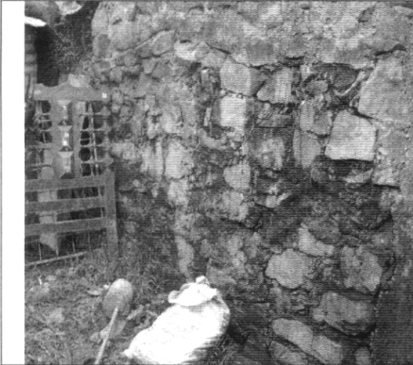
Fotografía No. 3. Muro de contención sobre el cual se encuentra emplazada la vivienda con nomenclatura Carrera 74B # 76 – 19 Sur