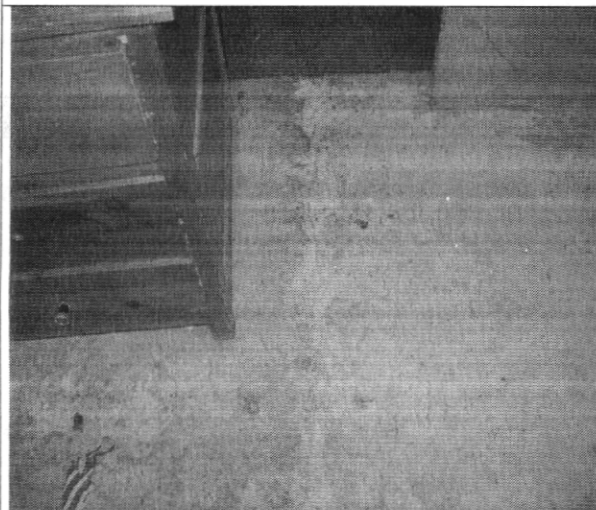
Fotografía No. 3. Fisuras en los pisos internos de la vivienda con nomenclatura Diagonal 40A Bis # 2K - 07 sur