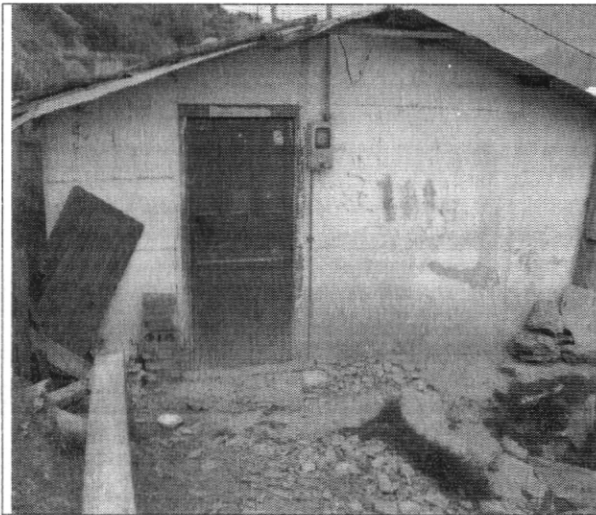
Fotografía No. 1. Fachada de la vivienda con nomenclatura Diagonal 40A Bis # 2K - 07 sur