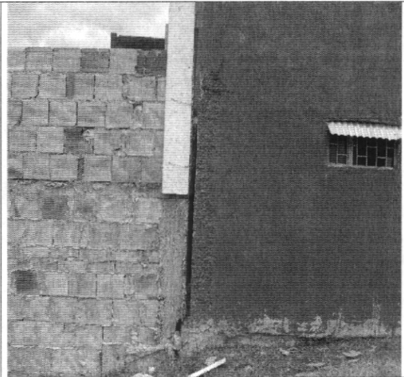
Fotografía No. 2 Desplazamiento de los muros divisorios en la parte posterior de la vivienda con nomenclatura Calle 123 B # 83 - 17