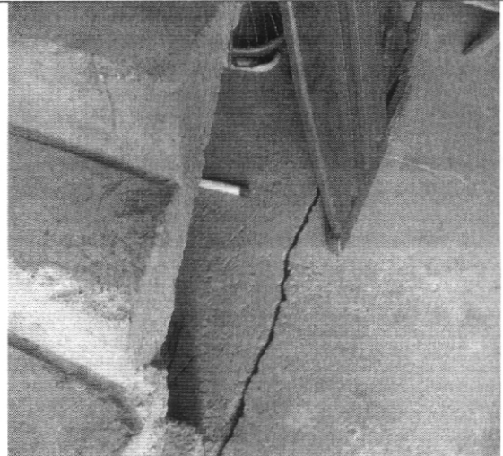
Fotografía No. 4. Fisuras en los pisos de la vivienda con nomenclatura Calle 123 B # 83 - 17