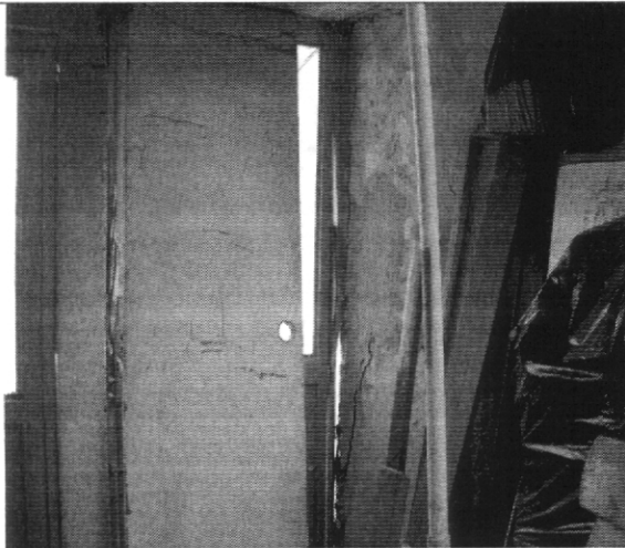
Fotografía No. 3. Detalle desplazamiento del muro de fachada en la vivienda con nomenclatura Calle 123 B # 83 - 17