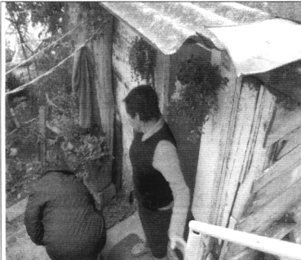
Fotografía No. 1. Fachada de la vivienda con nomenclatura Carrera 2B # 41 – 76 Sur.