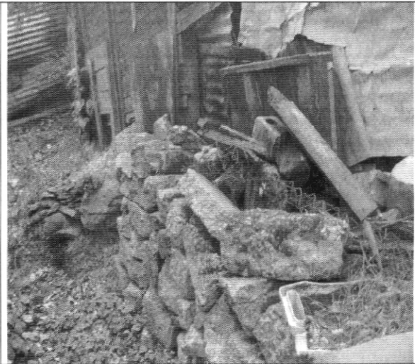
Fotografía No. 2 Estructura de contención provisional de la vivienda con nomenclatura Carrera 2B # 41 – 76 Sur.