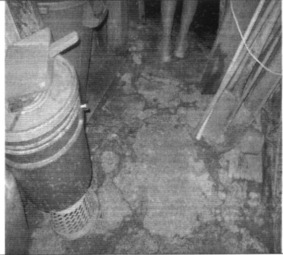
Fotografía No. 4. Agrietamientos en los pisos interiores de la vivienda con nomenclatura Carrera 2B # 41 – 76 Sur.