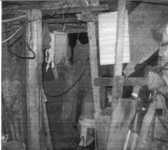
Fotografía No. 3. Perdida de verticalidad de las paredes internas de la vivienda con nomenclatura Carrera 2B # 41 – 76 Sur.