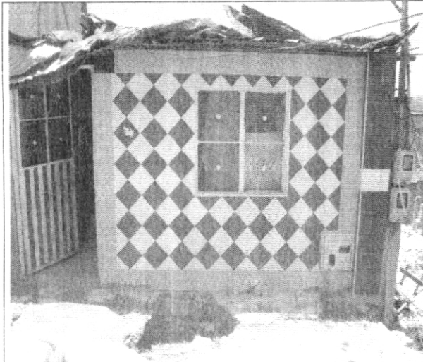
Fotografía No. 1. Fachada de la vivienda con nomenclatura Calle 62F Bis Sur # 75K – 16 Sur