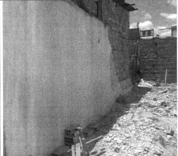
Fotografía No. 2. Muro lateral derecho de la vivienda vecina (evacuada y demolida) contigua al predio con nomenclatura Calle 62F Bis Sur # 75K – 16 Sur.