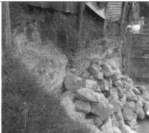
Fotografía No. 3. Parte posterior de la vivienda con nomenclatura Carrera 24 A # 71 – 04 Sur.