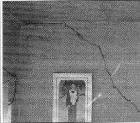
Fotografía No. 2 Agrietamiento de los muros perimetrales en la parte posterior de la vivienda con nomenclatura Transversal 18 Bis A # 78C – 53 Sur