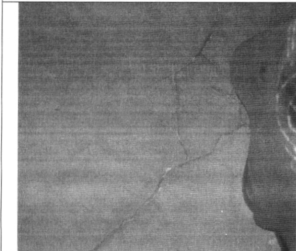
Fotografía No. 5. Detalle agrietamiento en los pisos interiores de la vivienda con nomenclatura Transversal 18 Bis A # 78C - 53 Sur