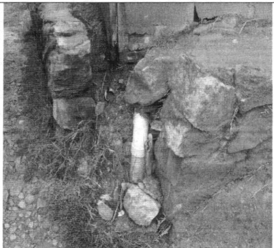
Fotografía No. 6. Perdida de material en el muro de contención de la vivienda con nomenclatura Transversal 18 Bis A # 78C - 53 Sur