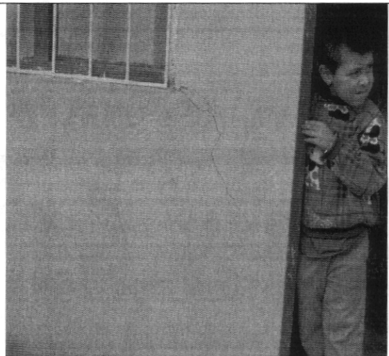
Fotografía No. 4. Detalle agrietamiento del muro de fachada en la vivienda con nomenclatura Transversal 18 Bis A # 78C - 53 Sur