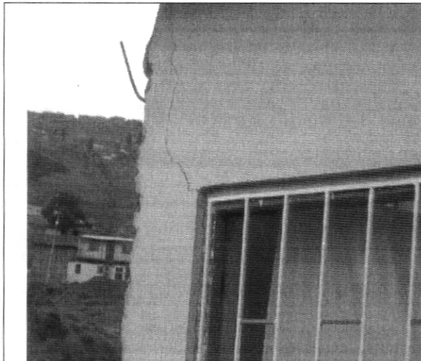
Fotografía No. 3. Detalle agrietamiento del muro de fachada en la vivienda con nomenclatura Transversal 18 Bis A # 78C - 53 Sur