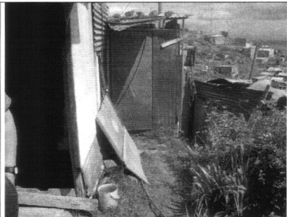
Fotografía No. 2 Parte posterior de la vivienda con nomenclatura Transversal 75G # 75C - 62 sur