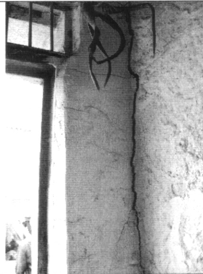
Fotografía 2. Separación del muro respecto a los muros transversales.