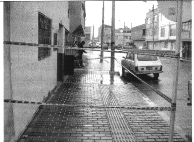
Fotografía 4. Señalización preventiva del paso peatonal al frente del predio ubicado en la Calle 27 # 32A - 27.