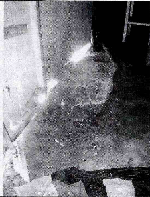
Fotografía 2. Vista del hundimiento del piso de la vivienda generado por los asentamientos que se presentan en la fundación de la misma. La zona exterior de la vivienda correspondiente se observa en la fotografía 1