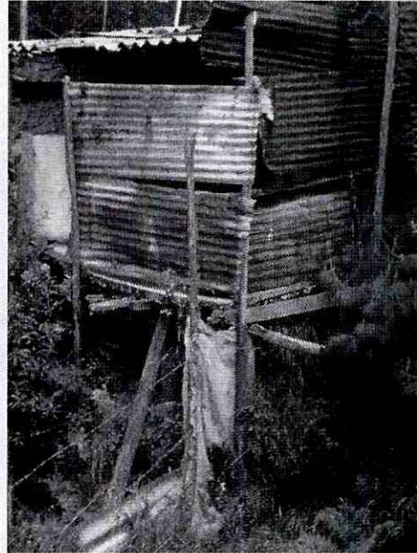
Fotografía 4. Vista de la parte posterior o patio, nótese la losa de concreto y el entramado de madera sobre el que se apoya