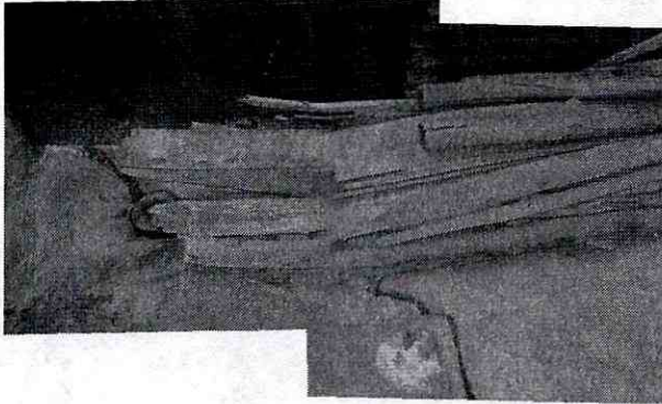
Fotografía 3. Vista de la losa de concreto aparentemente sin reforzar que evidencia fisuras, grietas y pérdida de horizontalidad