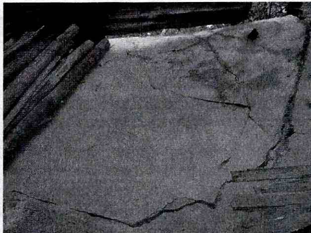
Fotografía 2. Vista de la losa de concreto aparentemente sin reforzar que evidencia fisuras, grietas y pérdida de horizontalidad