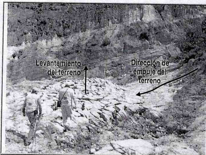
Fotografía 2. Vista del levantamiento del terreno o pandeo de los estratos de arenisca. Nótese como los bloques de roca se separan por las diaclasas y se desplazan hacia arriba.