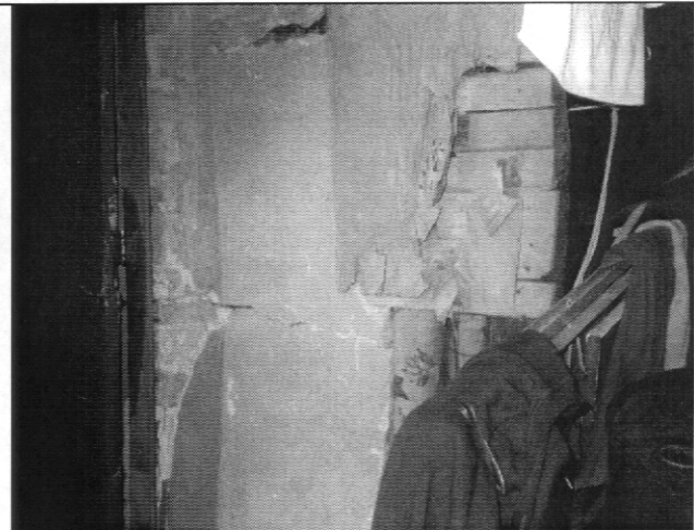
Foto 2. El proceso viene generando pérdida de verticalidad en la vivienda y agrietamientos en muros.