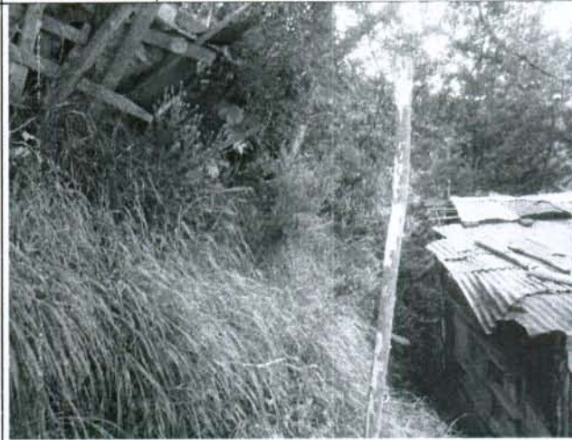
Foto 4. Talud potencialmente inestable ubicado sobre el costado izquierdo de la vivienda de la señora Yasmin Ramirez, en el cual se detectan agrietamientos en su parte alta.