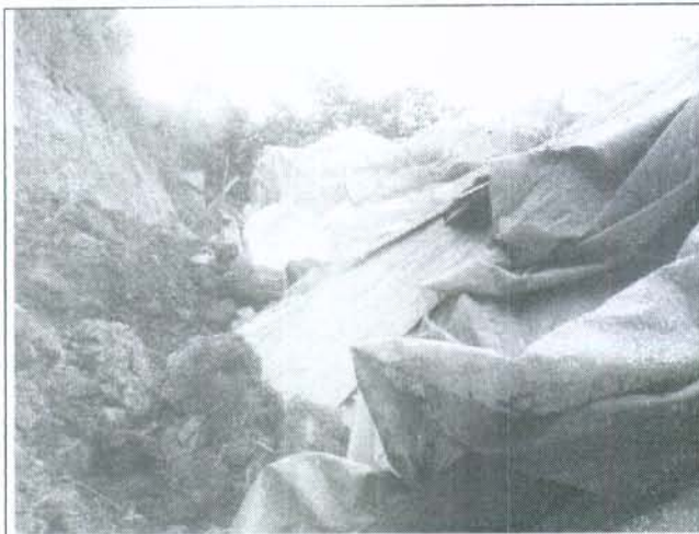
Foto 1. Falla de un talud sobre la parte posterior del predio, produciendo el colapso de este.