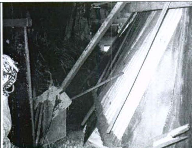
Foto 2. El fenómeno de inestabilidad afecto la estabilidad y habitabilidad del predio causando además daños en enseres.