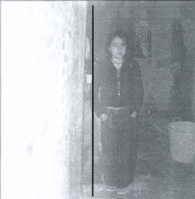
Foto 3. Se evidencia pérdida de verticalidad en muros y columnas a la vez que agrietamientos en los muros.