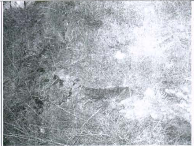
Foto 2. Agrietamientos del terreno,