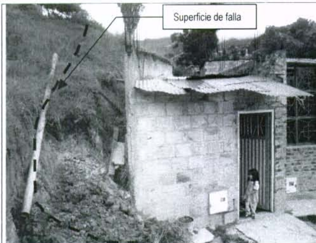
Foto 1. Falla de un talud sobre el costado izquierdo del predio de la calle 65 sur # 4 A - 42 este, afectando su estabilidad y habitabilidad.