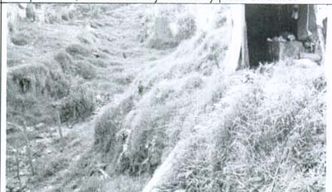
Foto 4. La vivienda colinda con el cauce de la quebrada La Marranera, se evidencian procesos de remoción en masa activos.

Foto 3. Los propietarios de la vivienda rompieron los tubos del alcantarillado para poder controlar los vertimientos de aguas residuales.