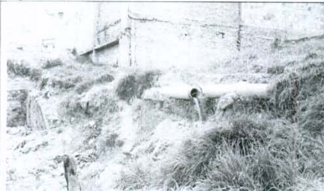
Foto 3. Los propietarios de la vivienda rompieron los tubos del alcantarillado para poder controlar los vertimientos de aguas residuales.

Foto 2. La vivienda es de un nivel, en materiales de recuperación, cubierta en teja de zinc y pisos en tierra.