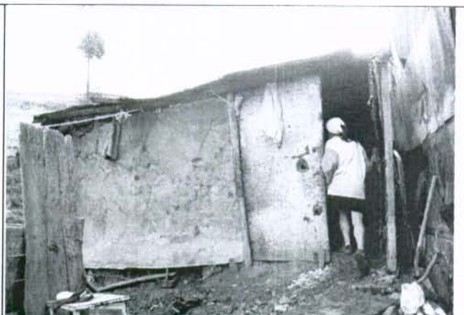
Foto 1. Flujo de tierras que afectó la vivienda del señor Argemiro Díaz.

Foto 2. La vivienda es de un nivel, en materiales de recuperación, cubierta en teja de zinc y pisos en tierra.