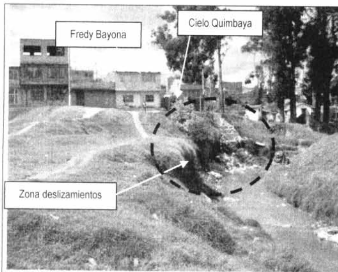
Fotografía 1. Vista general del sector antes de que se presentara el evento, la fotografía es del 30 de septiembre de 2004.