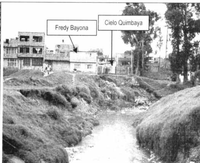
Fotografía 2. Sector, luego de que se presentaron los deslizamientos en la margen izquierda de la quebrada Chiguaza.