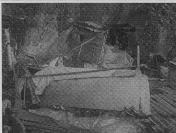
Fotografía 3: Vivienda en materiales de recuperación que representa amenaza para el sendero peatonal y la vivienda vecina