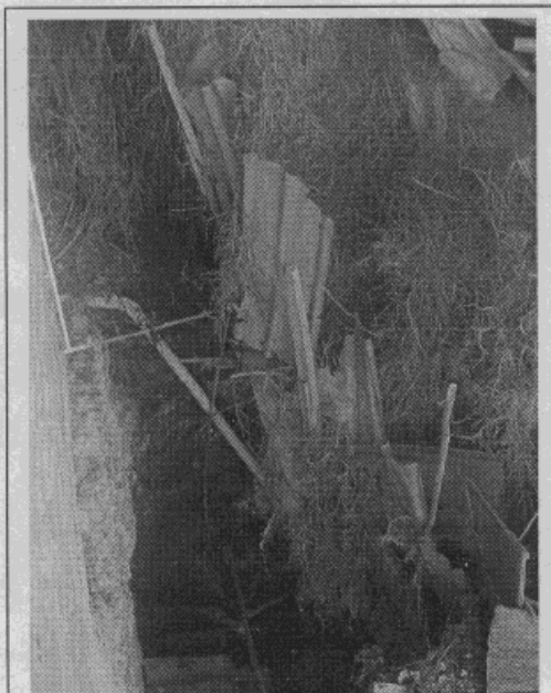
Fotografía 1: Se observa el material caído y el cerramiento que representa amenaza de caída sobre el sendero.