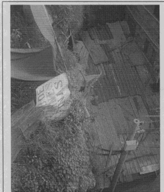
Fotografía 2: Vivienda localizada en la parte inferior del talud oriental, que puede verse afectada por caída de material.