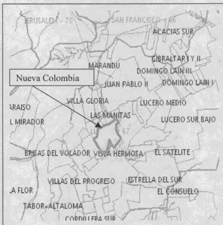
Figura No. 1. Mapa de Localización del Barrio Nueva Colombia

Para el presente diagnóstico se evaluó básicamente el sector del barrio Nueva Colombia que está ubicado sobre la margen izquierda del Zanjón Derecho de la Quebrada Limas, donde se cuenta con un estudio denominado "Zonificación de amenaza y riesgo por remoción en masa, evaluación de alternativas de mitigación y diseños detallados de las obras para estabilizar un tramo de la margen izquierda de la Quebrada El Zanjón de Limas en los barrios Las Manitas y Nueva Colombia, Localidad Ciudad Bolívar", realizado por la firma Ingeocim Ltda. En 1.999.