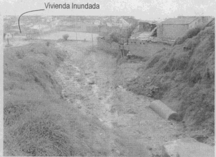
Foto 2: Trayectoria seguida por las aguas desbordadas del Caño El Baúl