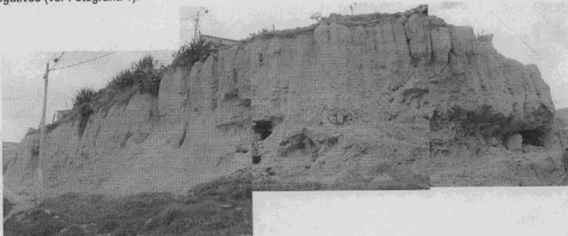
Fotografía No. 1.

El sector está conformado por un escarpe rocoso de 10.0 m de altura en el cual se observa un estrato de arcillolitas, altamente erosionado, meteorizado y fracturado. Igualmente, en algunos sectores del escarpe se han realizado excavaciones, especialmente en el costado occidental del mismo, generando escarpes negativos (ver Fotografía 1).