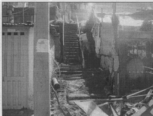
Foto 2. Vista del peatonal de la calle 191 al oriente de la Tv 23B.