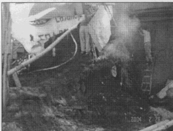
Foto 1. Corte al interior de la Tv 23B No. 190B-08; donde se presentó el flujo de tierras.

En la intersección de la transversal 23B con calle 191, tanto el tubo de agua potable como el poste de teléfonos están perdiendo el suelo de cimentación (ver Foto 3, Foto 4 y Foto 5).