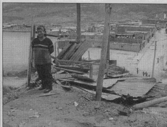
Foto No.4. Se observan los materiales que conformaban la vivienda.