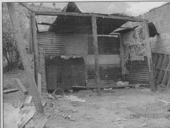
Foto No.2. Vista del único sector de la vivienda que quedó en pie. Se observan los materiales empleados para la construcción y su estado.