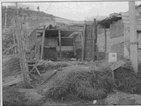
Foto No.1. Vista del predio y de los restos de la construcción.

Se asistió con ayudas humanitarias a la familia afectada.