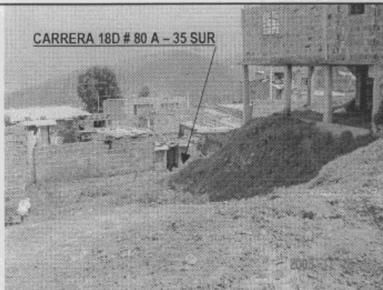
Fotografía 1. Zona verde por donde pasó el flujo de agua que arrastró el material suelto.