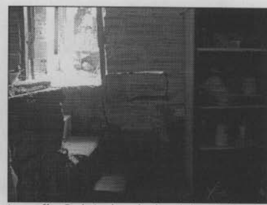
Fotografía 2. Interior de la vivienda hacia la parte oeste. Obsérvese el desplazamiento de la mampostería.