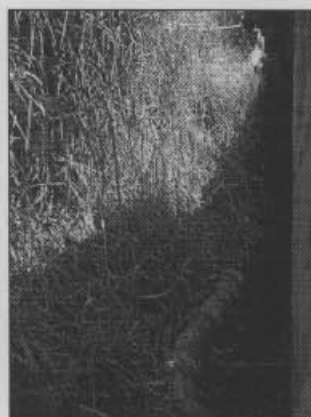
Fotografía 4. Parte posterior de la vivienda, costado sur. Allí se presenta humedad en el corte proveniente de la infiltración.