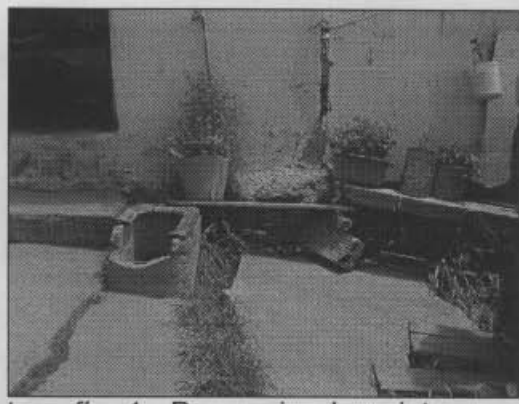
Fotografía 1. Presencia de grietas en el costado nor este

La presencia de grietas en la parte nor-este del predio ha permitido la infiltración y por lo tanto ha generado la socavación y pérdida de soporte de la cimentación en la esquina nor-este de la vivienda (Ver la Fotografía 1).