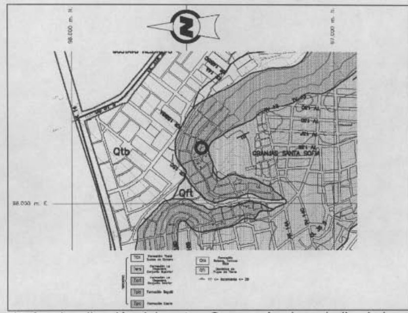
Figura 1. Geología y localización del sector. Con un círculo se indica la localización en el talud del predio de la señora Yolanda Camacho (Diagonal 32A Bis No. 15A-83). Tomado de INGEOCIM LTDA, 1998.