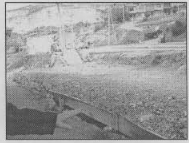
Fotografía 7 Ocupación zona pública