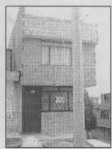
Fotografía 2 Vivienda ampliada de la manzana 93