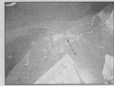
Fotografía 6 Fisuras acabado de piso

En algunas viviendas se empiezan a presentar daños en los acabados de piso en cemento y mineral (Fotografía 6), pero son debidos a que permanecen húmedos. En la parte alta de la manzana 93 se construyó un terraplén de 0.8 m de altura en zona pública (Fotografía 7) para emplazar una cancha de tejo. Se recomienda retirar dicho terraplén por la sobrecarga que genera y la posibilidad de colmatar las cunetas para el manejo de las aguas lluvias.