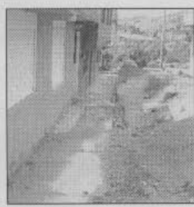
Fotografía 4 Obstrucción de cunetas

Algunas cunetas en el perímetro del área intervenida por la CVP se encuentran obstruidas (Fotografía 4), la reparación de las cunetas existentes y la inclinación de las escaleras hacia las casas en la parte posterior de la manzana 93 (Fotografía 5) generan problemas por la saturación local del terreno, nociva para el suelo de fundación de las viviendas.