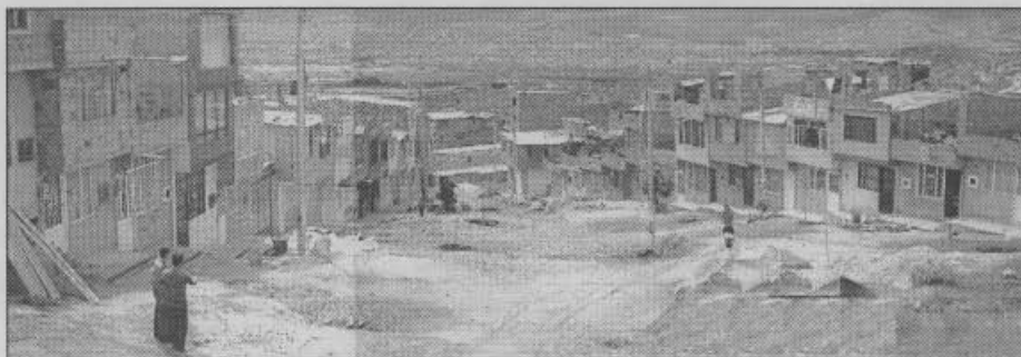
Fotografía 1 Vista general de las manzanas 93 y 63 de la Urb. Bosques de Madrigal

Durante las visitas del Mes de Mayo de 2003 a la Urbanización Arborizadora Alta - Bosques del Madrigal Manzanas, se encontró que se adelantaba en las zonas verdes la siembra de árboles (Fotografía 1).