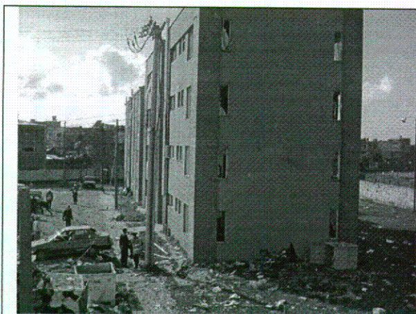
Foto 3. Vista desde los alojamientos, se observan dos edificios correspondientes a las casas fiscales.