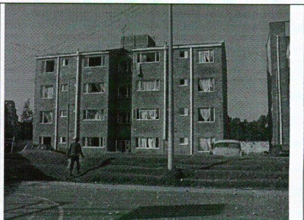
Foto 6. Edificio casas fiscales.