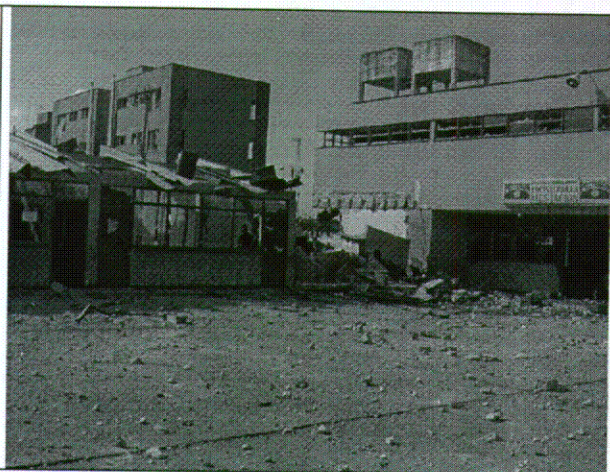
Foto 2. Vista desde el interior de la Estación de policía a la zona de mayor afectación. Al fondo edificio casas fiscales. Al frente izquierda área administrativa (1 piso). A la derecha comedor primer piso y alojamientos segundo piso.