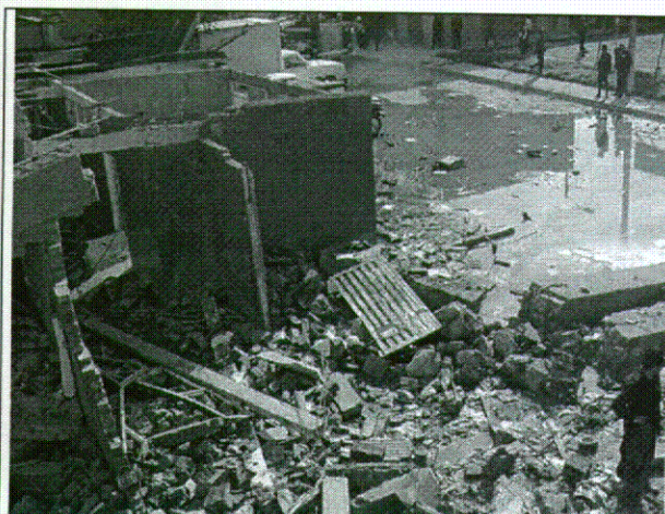
Foto 1. Punto donde se produjeron las explosiones. Las instalaciones del área administrativa sufrieron daño severo: ruptura generalizada de vidrios, caída de muros, ruptura y caída de tejas.