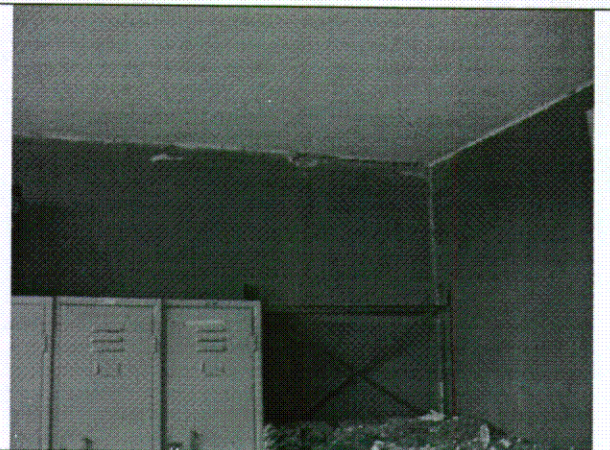
Foto 4. Desde el interior del alojamiento mas cercano a la explosión. Se observa agrietamiento entre el muro de fachada y la placa de cubierta.