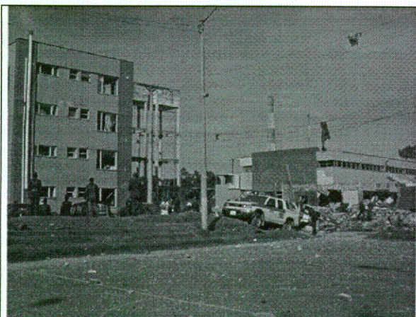
Foto 5. A la derecha edificio casas fiscales. A la derecha lugar de la explosión, al fondo instalaciones del comedor y alojamientos.