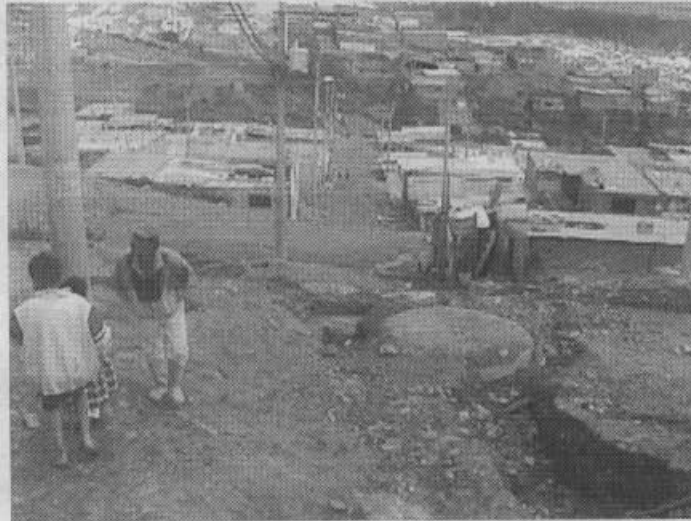
Foto 1. Barrio El Cerro del Diamante, localidad de Ciudad Bolívar. Vista de la Carrera 89 hacia el norte, desde la Calle 57 sur. Por esta carrera pasa una línea de la red de alcantarillado de aguas lluvias y aguas negras, construida recientemente. Se observa uno de los pozos.