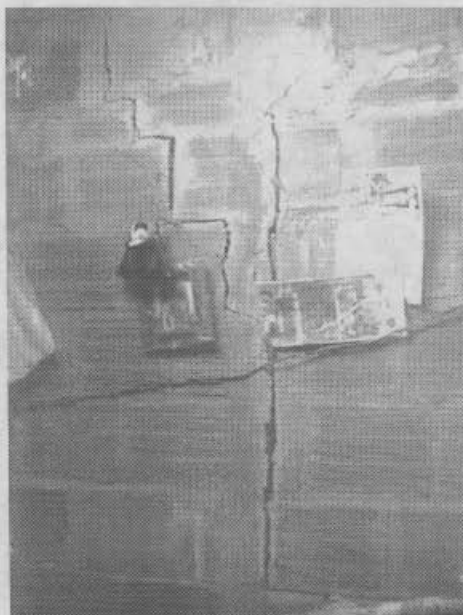
Foto 4. Muro lateral del predio ubicado en el lote 18 de la manzana 82 del barrio El Espino I Sector, propiedad del señor Argemiro Varón.