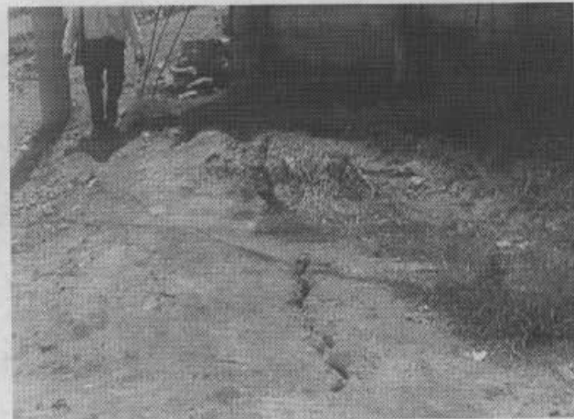
Fotos 2 y 3. Agrietamientos del terreno en el barrio El Cerro del Diamante. La foto 2 corresponde a la parte occidental de la manzana 27 y la foto 3 corresponde a la manzana 16, a la altura del predio ubicado en el lote 14, la grieta atraviesa la Calle 57 A Sur.