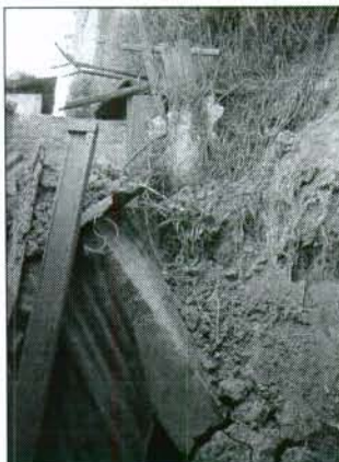
Fotografía 1. Parte posterior de la vivienda. Obsérvese el muro que colapso por el Empuje del material involucrado en el deslizamiento.

El deslizamiento afectó el patio de la vivienda antes mencionada, involucrando directamente el muro del baño (Ver la Fotografía No. 1), el cual no soporto el empuje súbito ejercido por el material que se deslizó.