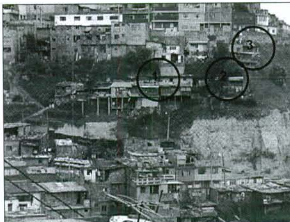
Fotografía 3. Localización en el talud de las viviendas a reubicar