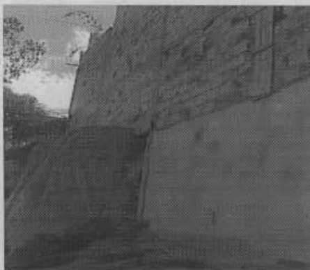
Conformación de las viviendas sobre la calle 43 sur

El barrio el Triunfo fue legalizado mediante la resolución 1126 de 1996, el sector está consolidado, cuenta con vías, servicios públicos y la mayor parte de las viviendas están construidas en mampostería e inclusive con sistemas aporticados de 2 pisos. El presente diagnóstico corresponde al resultado de la visita técnica realizada la Dirección de Prevención y Atención de Emergencias de Bogotá solicitada por los habitantes de la zona.