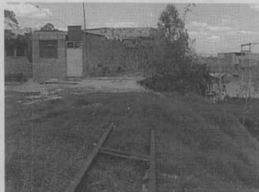
Viviendas calle 42 sur Caño Los Políticos