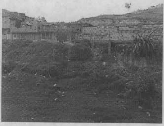
Viviendas sobre la ladera en la calle 42 sur.