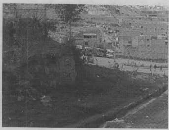
Ladera con algún grado de alteración Caño Los Políticos