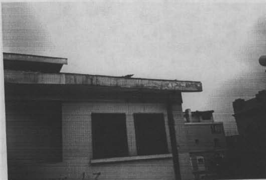
Fotografía No. 2. Extremo sureste de la plaza La Concordia. Se observan algunas grietas horizontales en la losa de la cubierta.