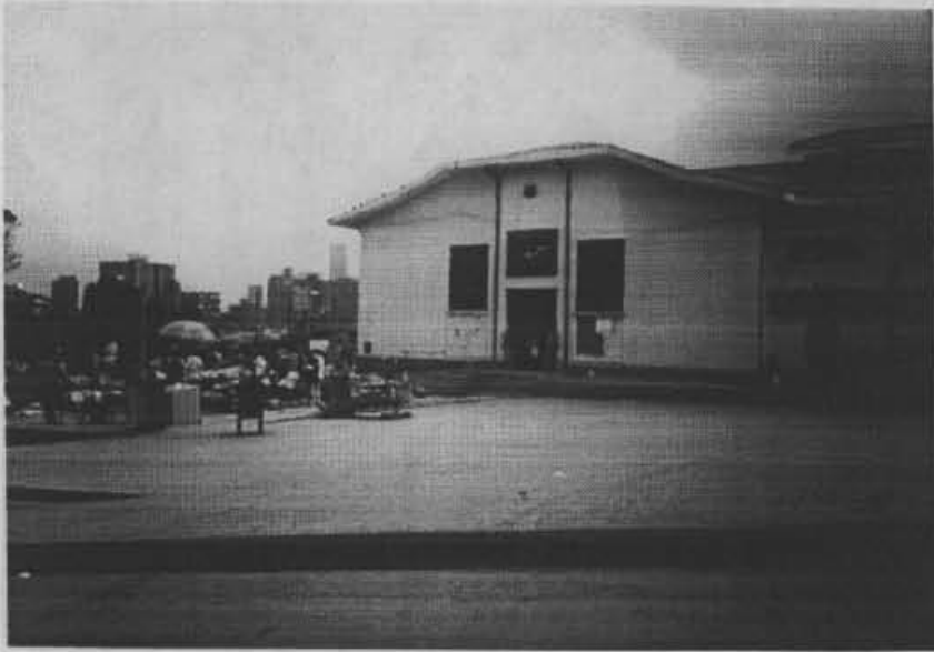
Fotografía No. 1. Plaza La Concordia. Costado sur de la plaza.